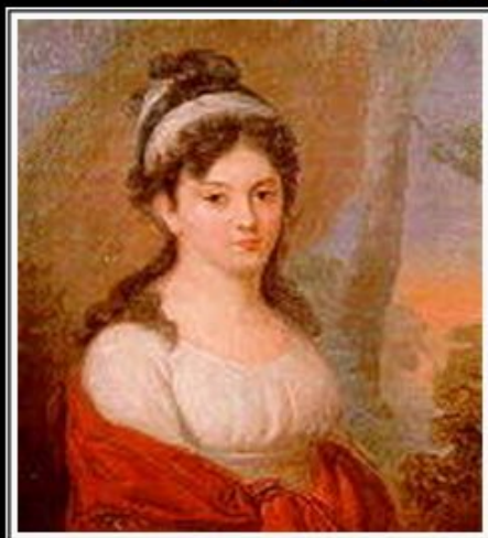
Е. А. Тютчева, мать поэта 1776-1866