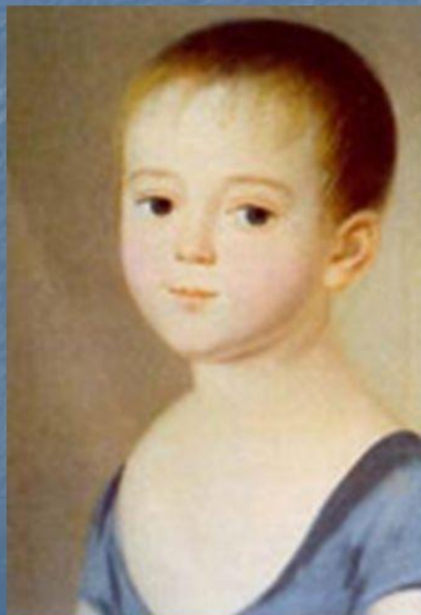
Тютчев в детстве

Федор Иванович Тютчев родился в родовитой дворянской семье в селе Овстуг Орловской губернии (ныне Брянская область) 23 ноября 1803 года.