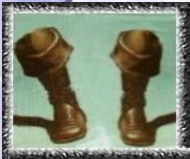
«Кот в сапогах»