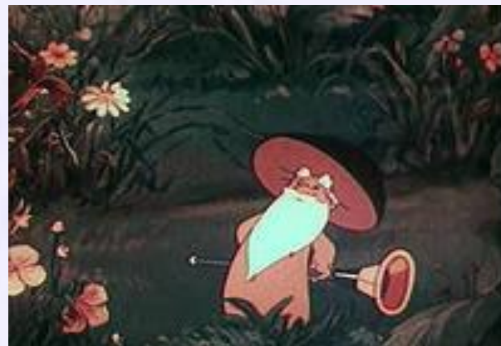
«Дудочка и кувшинчик»