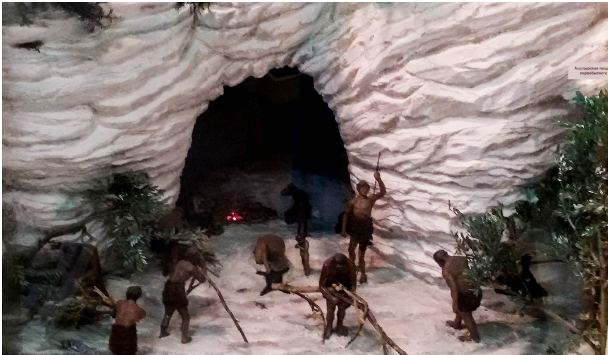
Азильская пещера первобытного