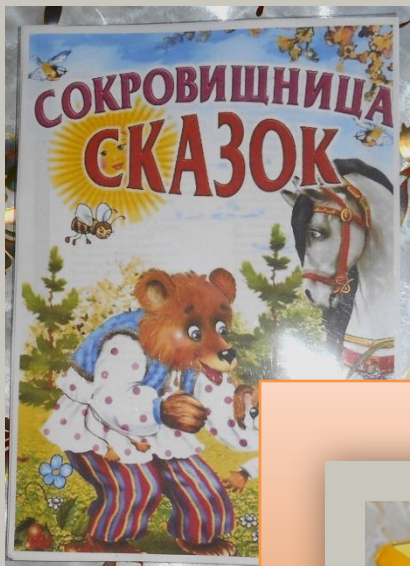
«Сокровищница сказок» (сборник произведений для игр в театральном уголке)