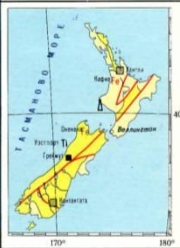
Масштаб 1:25 000 000 (в 1 см 250 км) 200 0 250 500 750 1000 1250