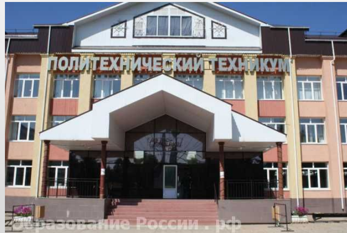
Алметьевский политехнический техникум