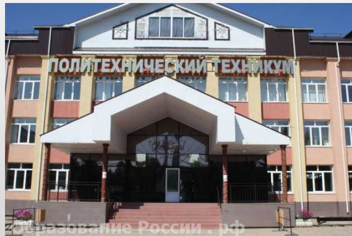
Алметьевский политехнический техникум