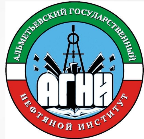
Алметьевский государственный нефтяной институт