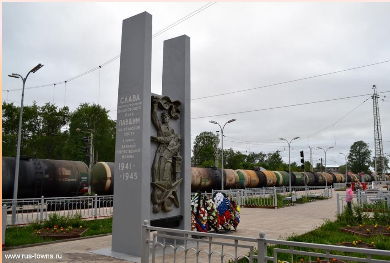
Памятник железнодорожникам, погибшим в годы войны на вокзале г.Бологое