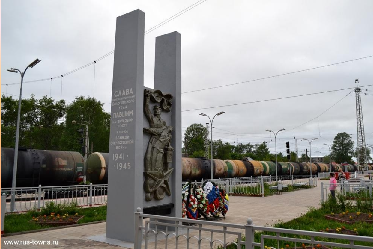
Памятник железнодорожникам, погибшим в годы войны на вокзале г.Бологое