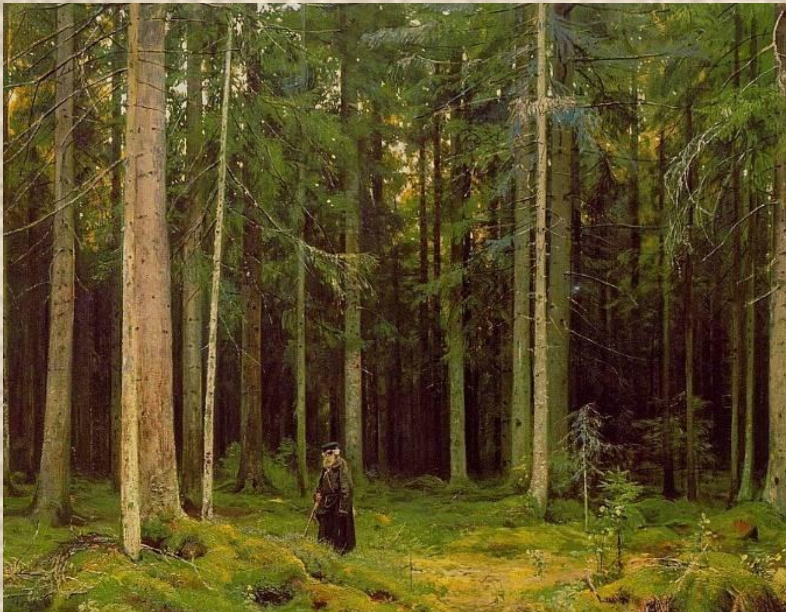
И.И.Шишкин «В лесу графини Мордвиновой»