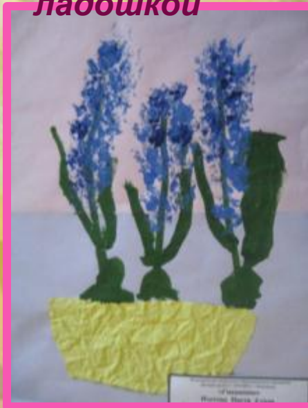
Печать мятой бумагой