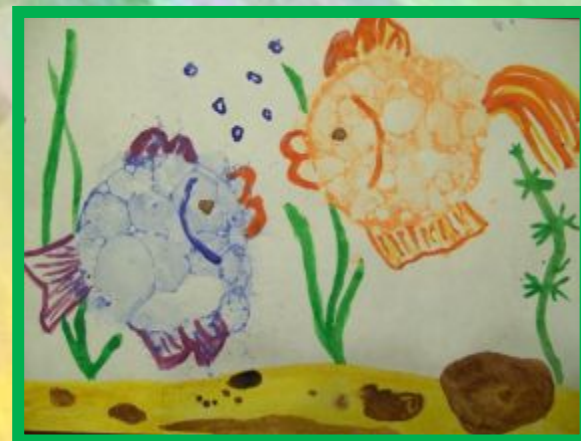
Рисование мыльными пузырями