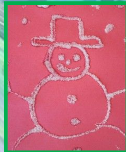
Рисование солью, песком