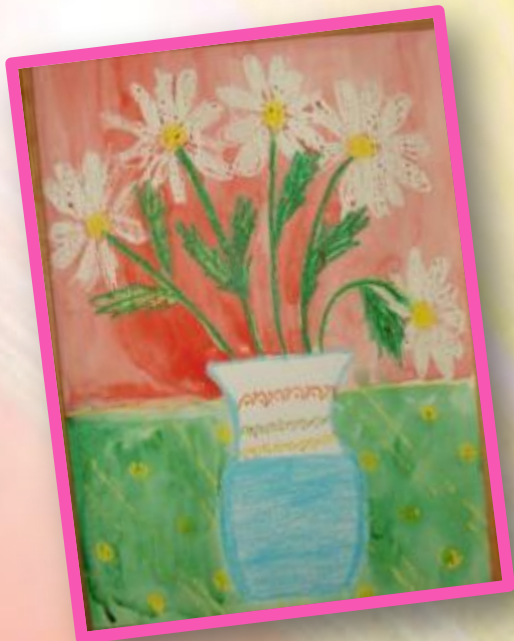
Восковой мелок и акварель