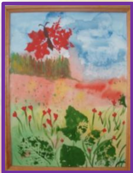
Акварель по сырому и печать листьями