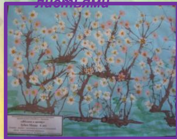
Выдувание краски трубочкой и печать ватной