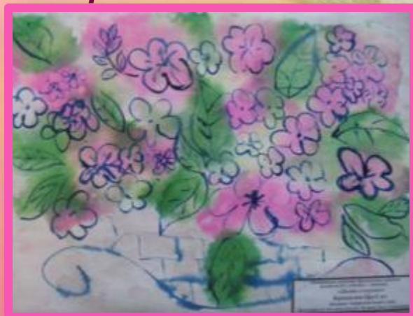
Отпечаток мокрой гофрированной бумагой