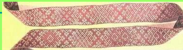
Пояс Прибалтийских Славян. Латвия. сер. XIX в.