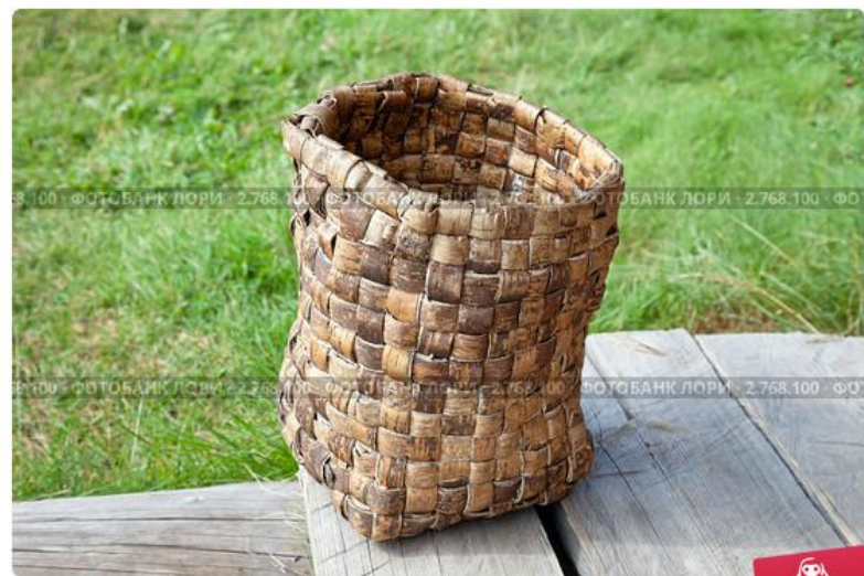
Старинный туесок из бересты