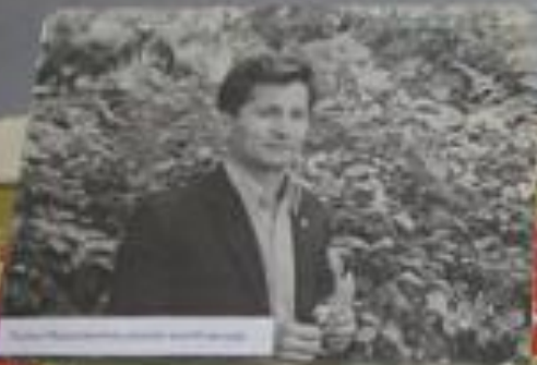
Александр Александрович Блок