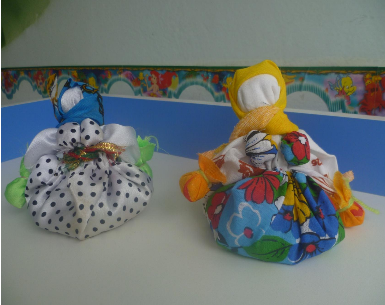
КУКЛА ОБЕРЕГ «КУБЫШКА – ТРАВНИЦА»