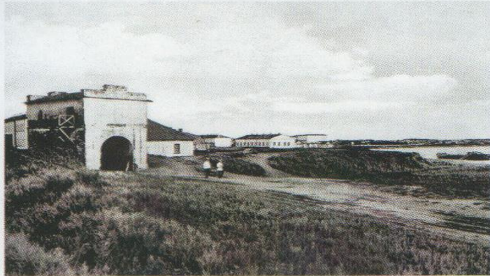
Тобольские ворота Омской крепости. Нач. XX в. Ворота построены в 1792 г. на западной стороне крепости. Сохранились до наших дней.

Тобольские ворота построены в 1791-1793 гг. Сохранились до наших дней. Через эти ворота въезжали в крепость с западной стороны. Названы они так потому, что дорога от них вела в город Тобол.