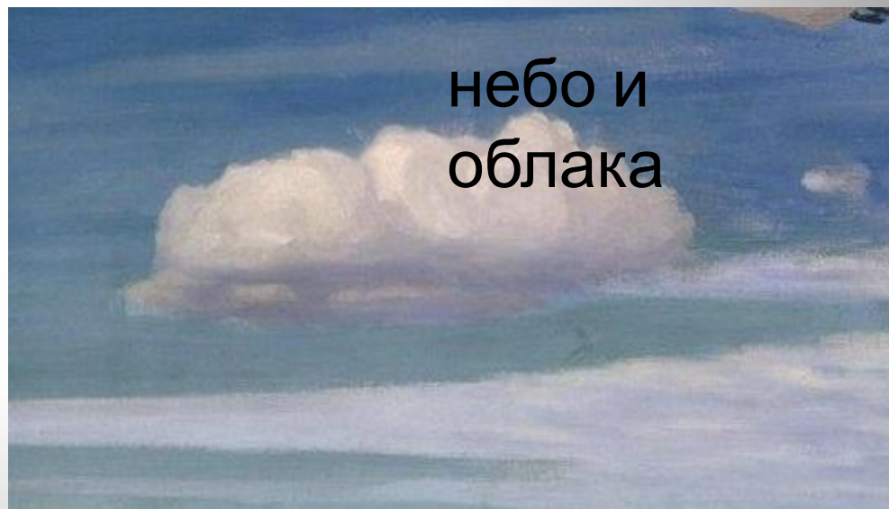
небо и облака