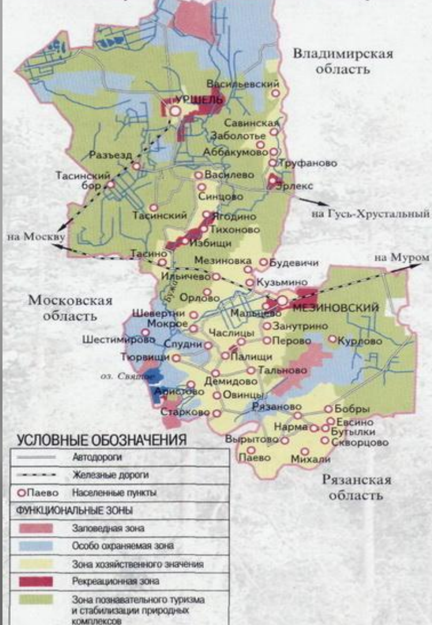
СХЕМА НАЦИОНАЛЬНОГО ПАРКА «МЕЩЕРА»

Мещера — это низменная равнина, расположенная в пределах Московской, Владимирской и Рязанской областей, между реками Клязьмой, Окой, Судогой и Колпью. Многочисленные озера и болота оказывают смягчающее влияние на климат. Центральная часть Мещеры целиком относится к бассейну реки Оки. Основными реками здесь являются Польша и Бужа. Юго-восточная часть территории парка относится к бассейну реки Гусь. На территории парка находится самое северное из этих озер - Святое, общей площадью около 500 га, из них в границах парка - 200 га. Озеро Святое - мелководное (1,0-1,5 м), сильно заросшее с песчаными, местами оторфованными берегами.