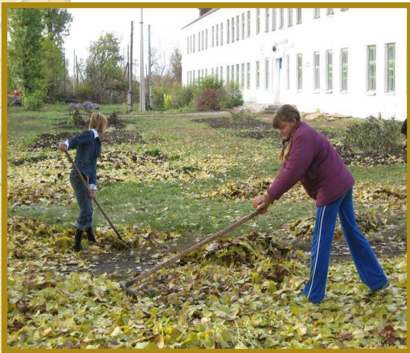
Трудовой десант «Листопад»