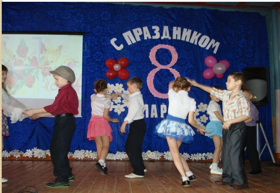
Танец «Рио- Рита»