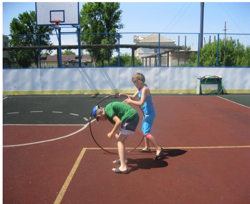
Детский летний лагерь «Родничок»