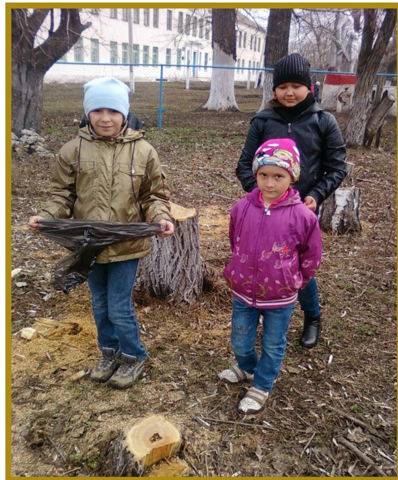
Трудовой десант «Приведи в порядок школьную территорию»