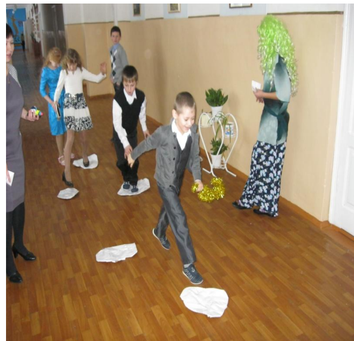
Игры на переменах