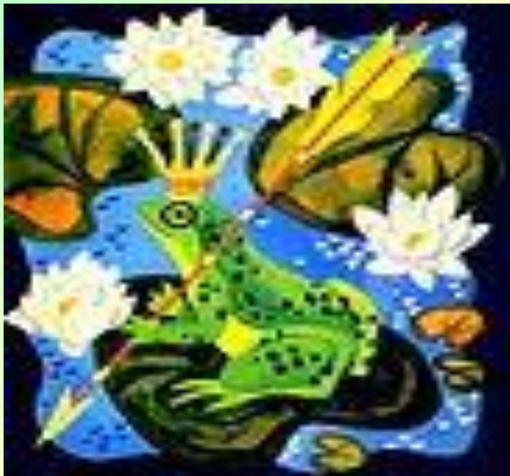
«Царевна - Лягушка»