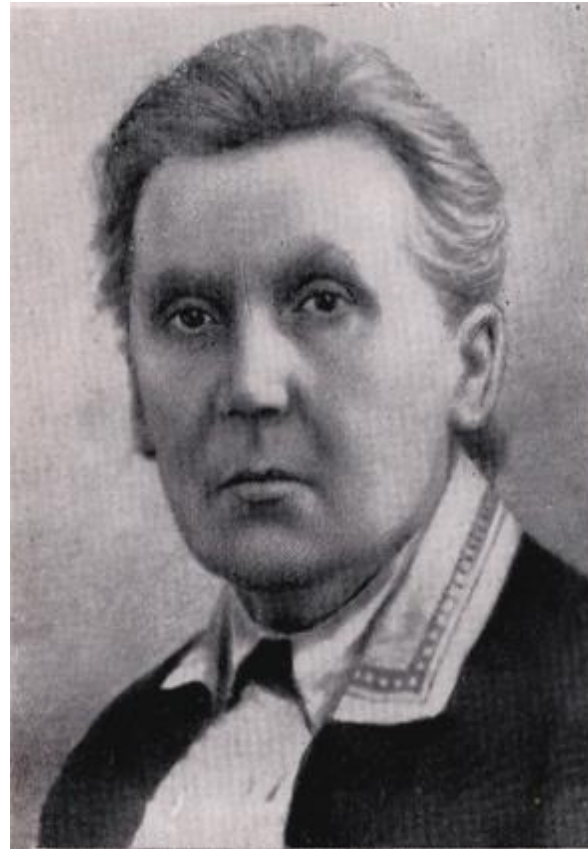
Елизавета Ивановна Тихеева