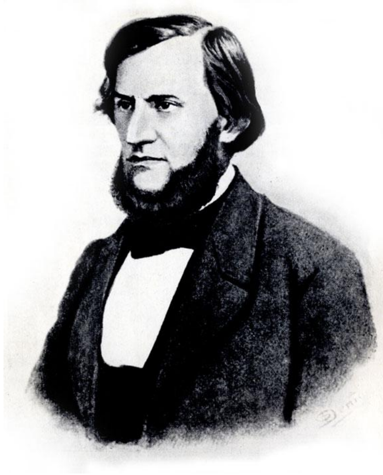
Константин Дмитриевич Ушинский