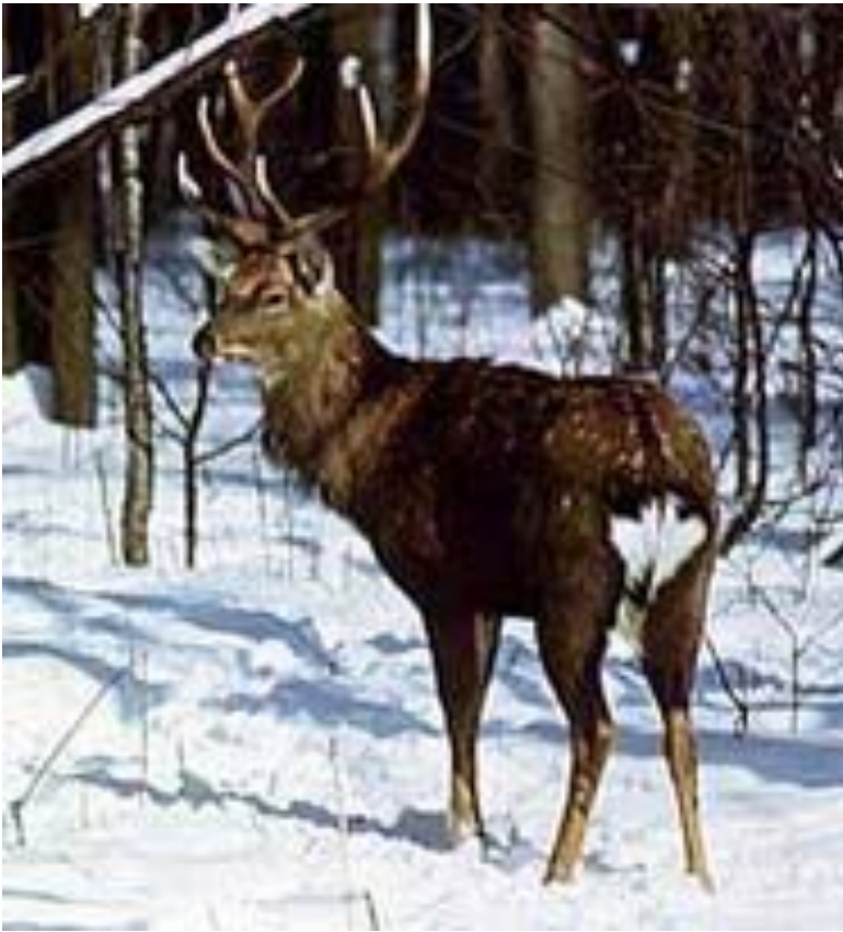
Пятнистый олень (Красный лес)