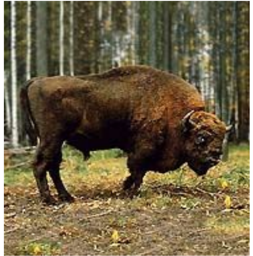
Зубр (Кавказский биосферный заповедник)