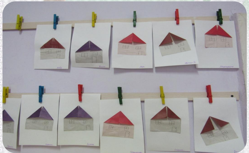
Аппликация: «Домик с треугольной крышей»