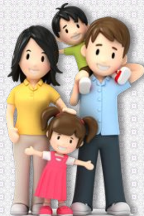
ФОТО ОТЧЁТ ПО ПРОЕКТУ