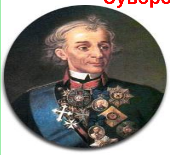
Александр Васильевич Суворов