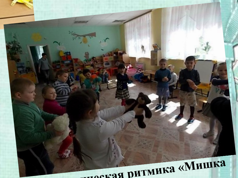
Логопедическая ритмика «Мишка пляшет»