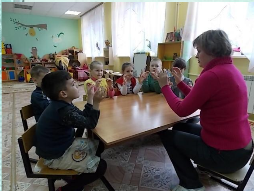
Игровые упражнения для активизации моторики рук. « Бинокль»