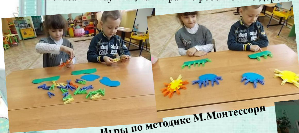
Игры по методике М.Монтессори

Цель начального этапа – обучить детей свободно и непринужденно пользоваться движениями своих рук при помощи игровых упражнений. Заинтересовать детей пальчиковыми играми и научить использовать ими в режимных моментах. Провести работу с родителями о необходимости развития мелкой моторике пальцев рук у детей. Показать и научить, как играть с ребёнком по дороге из детского сада.