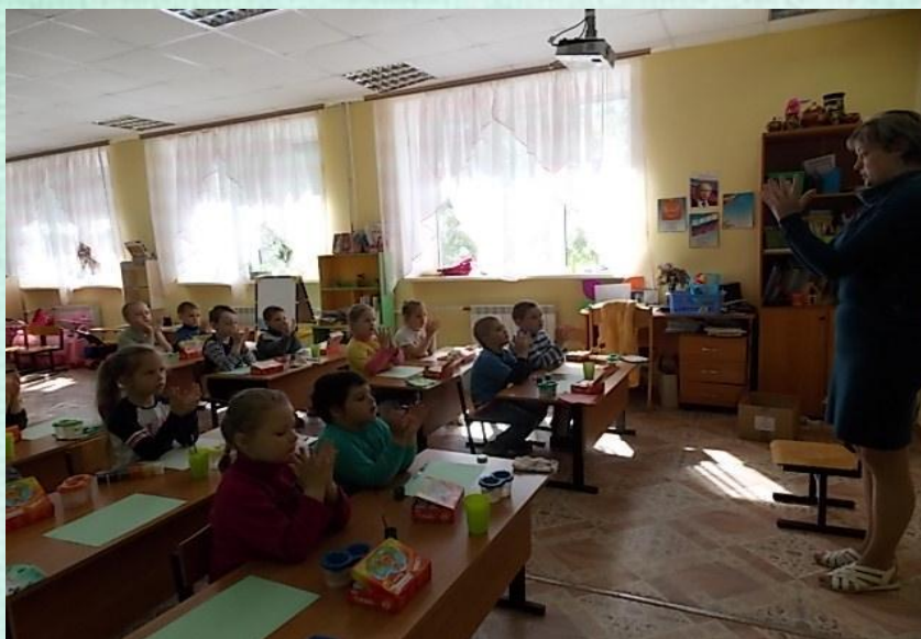
НОД пальчиковая гимнастика «Цветок»