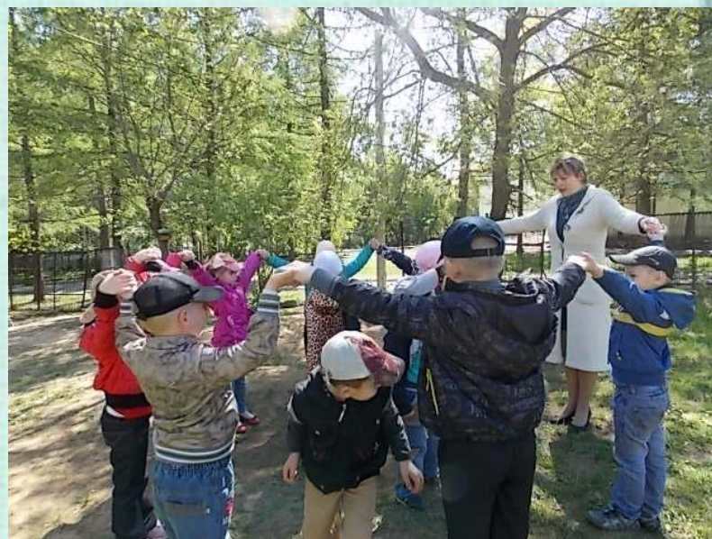
Подвижная игра «Мышеловка»