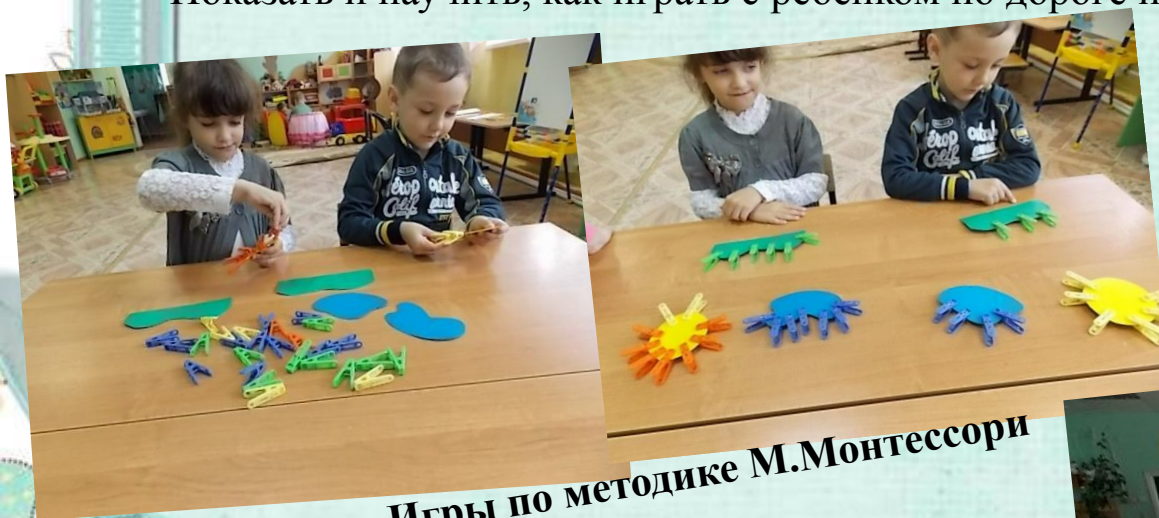
Игры по методике М.Монтессори

Цель начального этапа – обучить детей свободно и непринужденно пользоваться движениями своих рук при помощи игровых упражнений. Заинтересовать детей пальчиковыми играми и научить использовать ими в режимных моментах. Провести работу с родителями о необходимости развития мелкой моторике пальцев рук у детей. Показать и научить, как играть с ребёнком по дороге из детского сада.