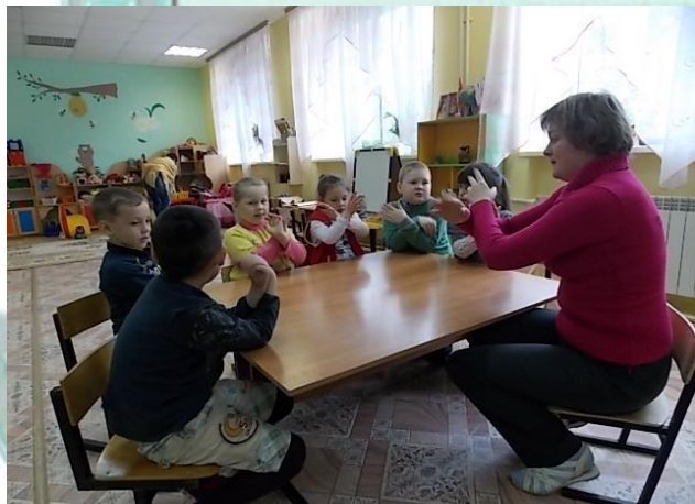
Игровые упражнения для снятия мышечного тонуса «Птица»

Цель следующего этапа – закреплять и совершенствовать свободное и непринужденное движение своих рук при помощи игровых упражнений; умение детей играть в пальчиковые игры. Продолжать работу с родителями по знакомству с игровыми упражнениями, в которые можно играть в домашних условиях.