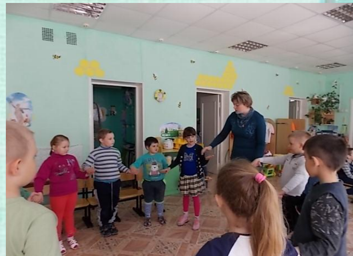
Пальчиковая гимнастика с рифмованным текстом «Летела корова»