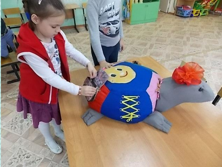
Игры по методике М.Монтессори