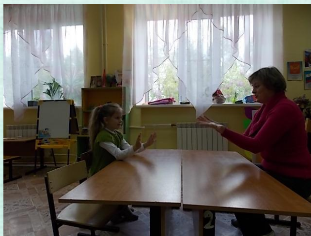
Пальчиковые упражнения «Помощники»