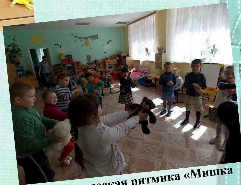
Логопедическая ритмика «Мишка пляшет»