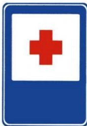
Пункт первой медицинской помощи