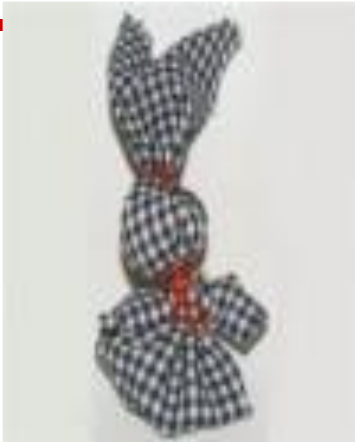
Зайчик на пальчик