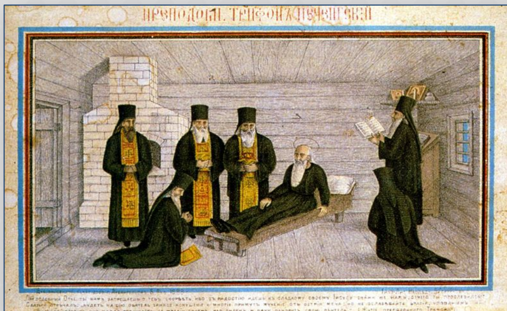
Кончина прп. Трифона Печенгского. Литография 1888