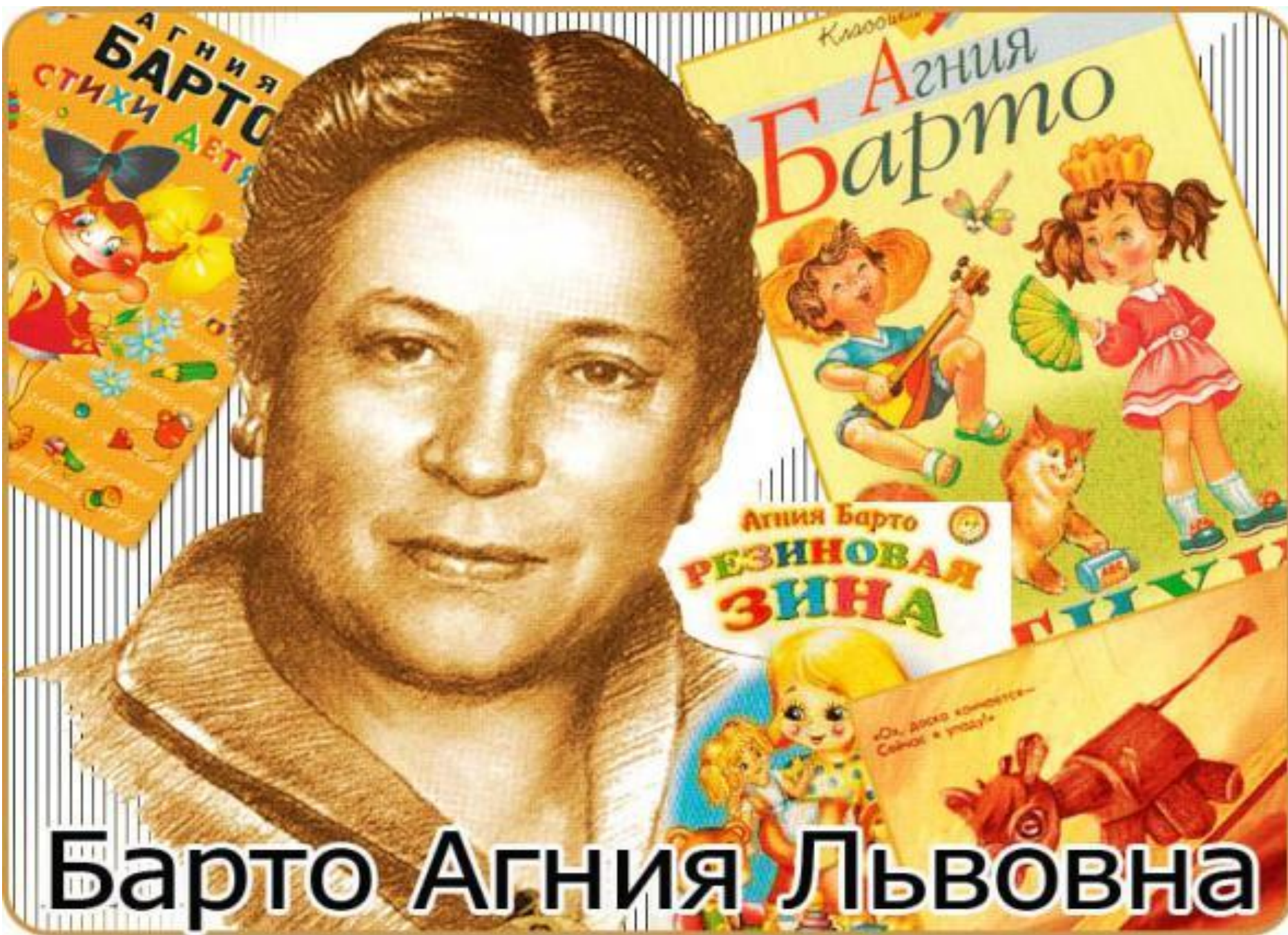
Барто Агния Львовна