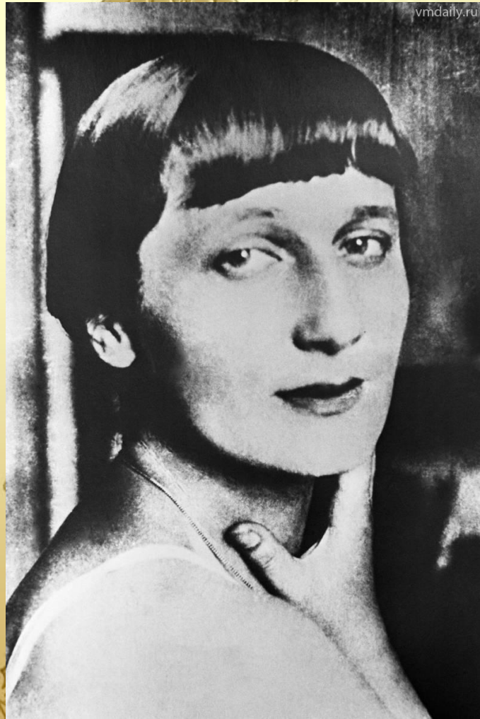
АННА АНДРЕЕВНА АХМАТОВА

Настоящая фамилия Горенко. Русская поэтесса. Автор многих поэтических сборников: "Четки", "Бег времени"; трагического цикла стихов "Реквием" о жертвах репрессий 1930-х годов.