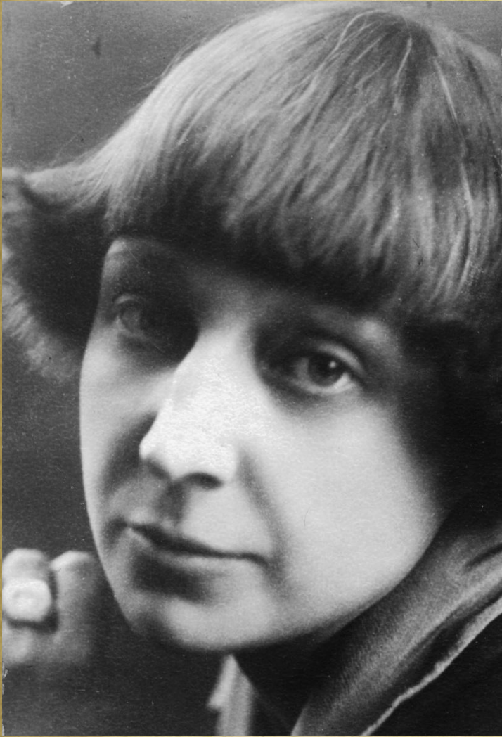
МАРИНА ИВАНОВНА ЦВЕТАЕВА

Русская поэтесса. Наиболее известны сборники стихов: "Версты" (1921), "Ремесло" (1923), "После России" (1928). Писала также лирическую прозу, эссе о А.С. Пушкине, А. Белом, В.Я. Брюсове, М.А. Волошине, Б.Л. Пастернаке и др.