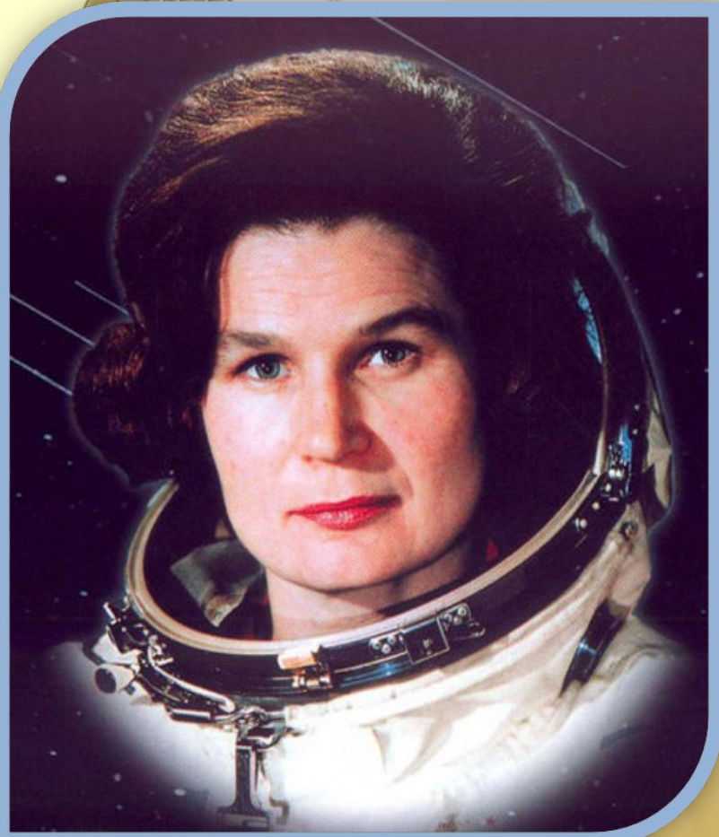
ВАЛЕНТИНА ВЛАДИМИРОВНА ТЕРЕШКОВА

Первая в мире женщина-космонавт (1963), кандидат технических наук, герой Советского Союза, председатель комитета советских женщин (1968–1987). В 1987–1992 годах председатель Союза обществ дружбы и культурных связей с зарубежными странами. С 1994 года руководитель Российского центра международного научного и культурного сотрудничества.