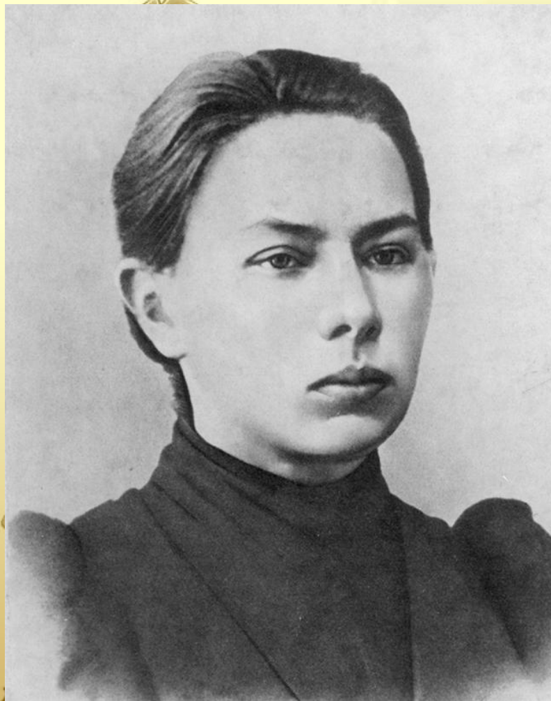
НАДЕЖДА КОНСТАНТИНОВНА КРУПСКАЯ

Жена вождя большевиков В.И. Ленина. Член "Союза борьбы за освобождение рабочего класса" с 1898 года. Секретарь редакции газет "Искра", "Вперед", "Пролетарий", "Социал-демократ". Участница революций 1905–1907 годов и Октябрьской революции. Имеет труды по педагогике, истории КПСС.