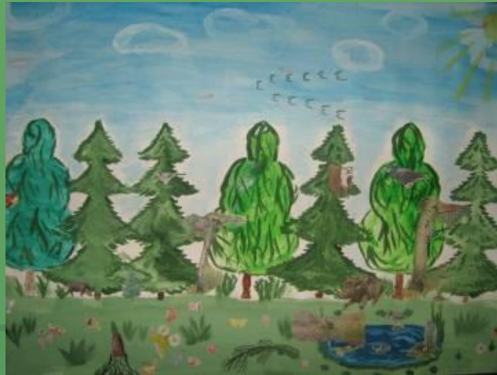
«По лесным тропинкам»