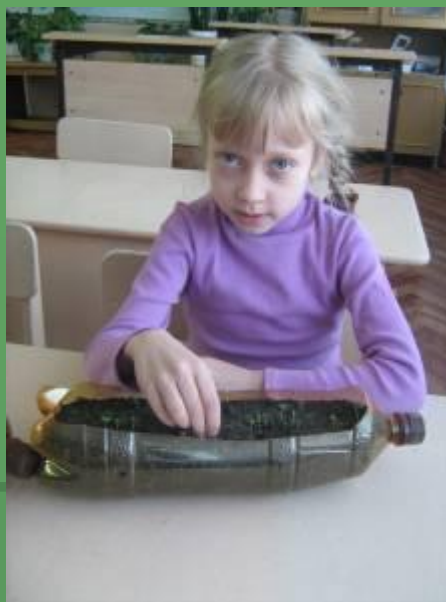
Уход за посевами