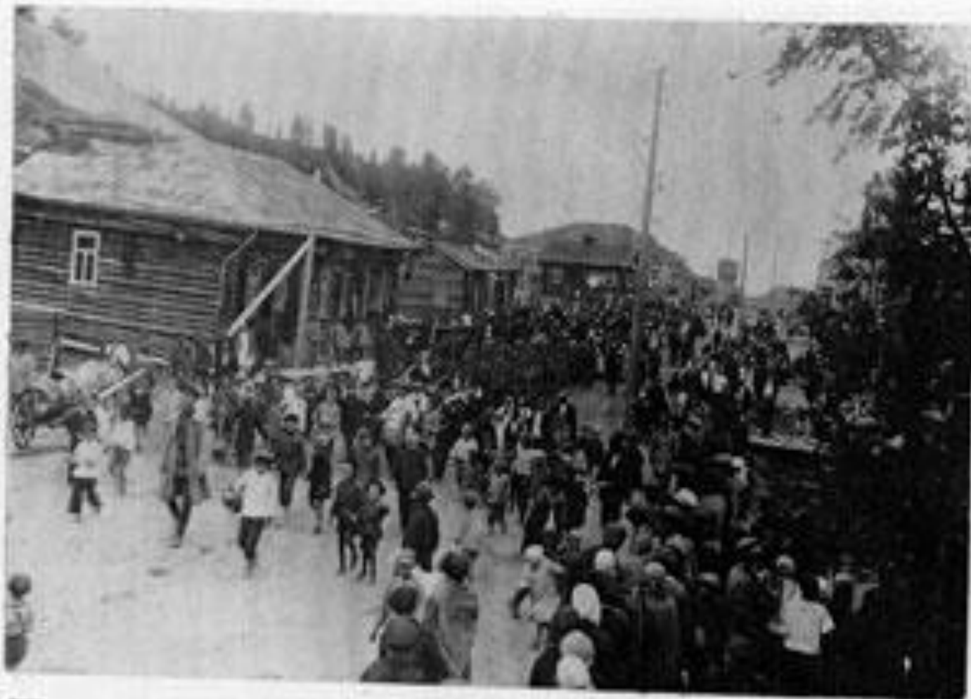
Трудящиеся с Самары идут на заказку