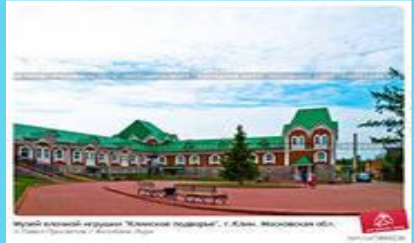
Музей народной игрушки "Клинское Подворье", г. Клин, Московской обл., в рамках Программы "Устойчивое развитие"