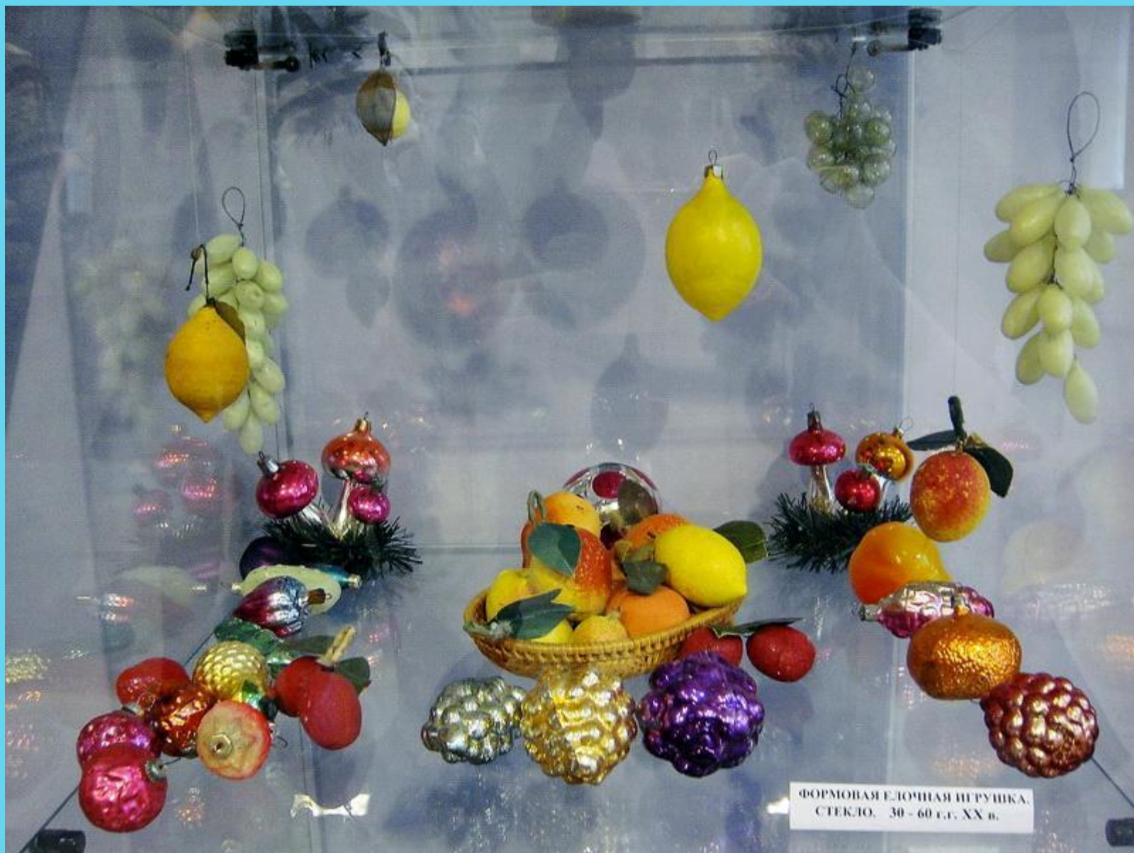
ФОРМОВАЯ ЕЛОЧНАЯ ПИРУШКА, СТЕКЛО. 30 - 60 г.г. XX в.