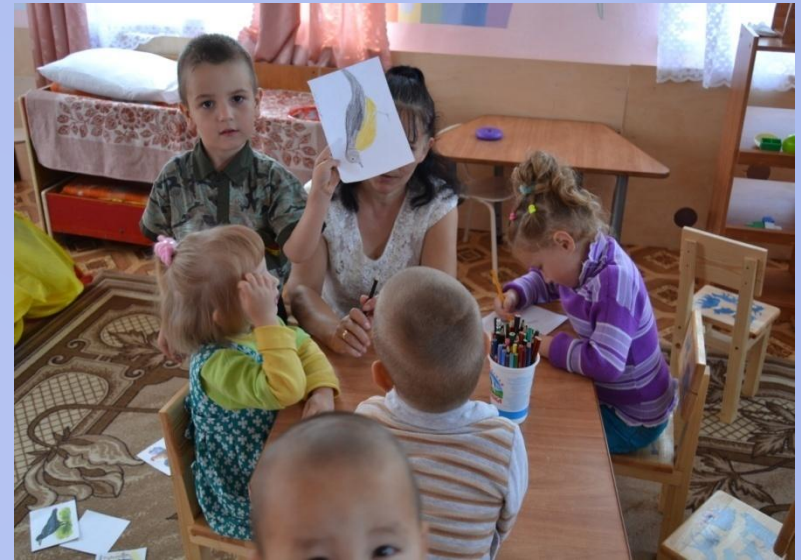
«Вместе дело спориться.»

- Совместная продуктивная деятельность доставляет удовольствие как детям , так и взрослым.