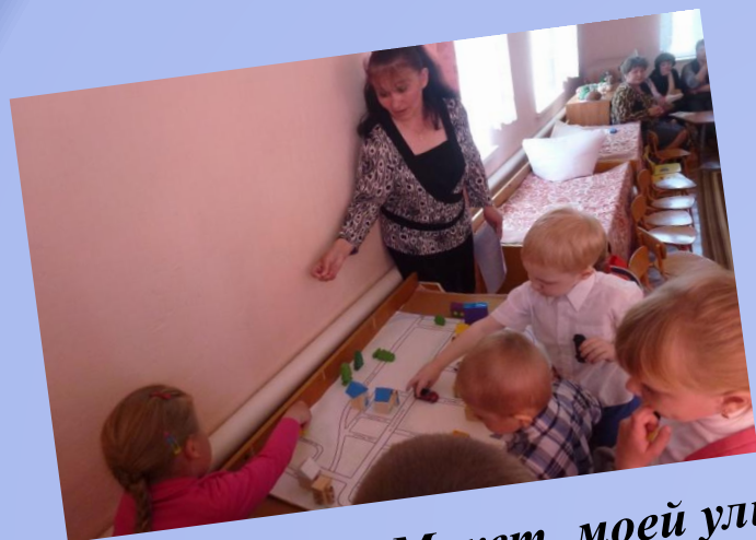
Макет моей улицы