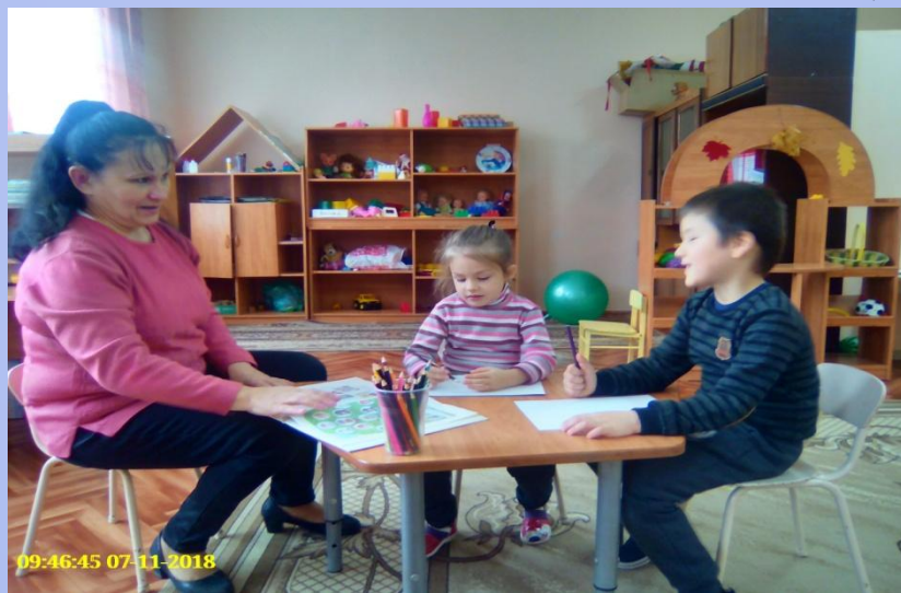
Рисуем: «Моя семья»