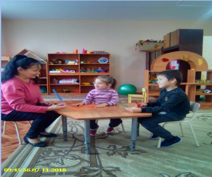
«Воспитатель и я, лучшие друзья »

- Давно доказано учёными-психологами, что занятия живописью и лепкой чрезвычайно благотворно влияют и на детей, и на взрослых.