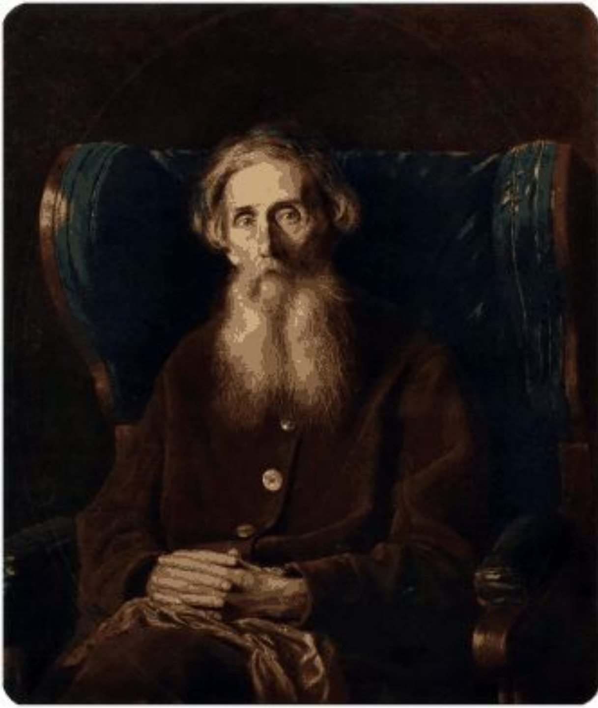
Даль Владимир Иванович 1801-1872