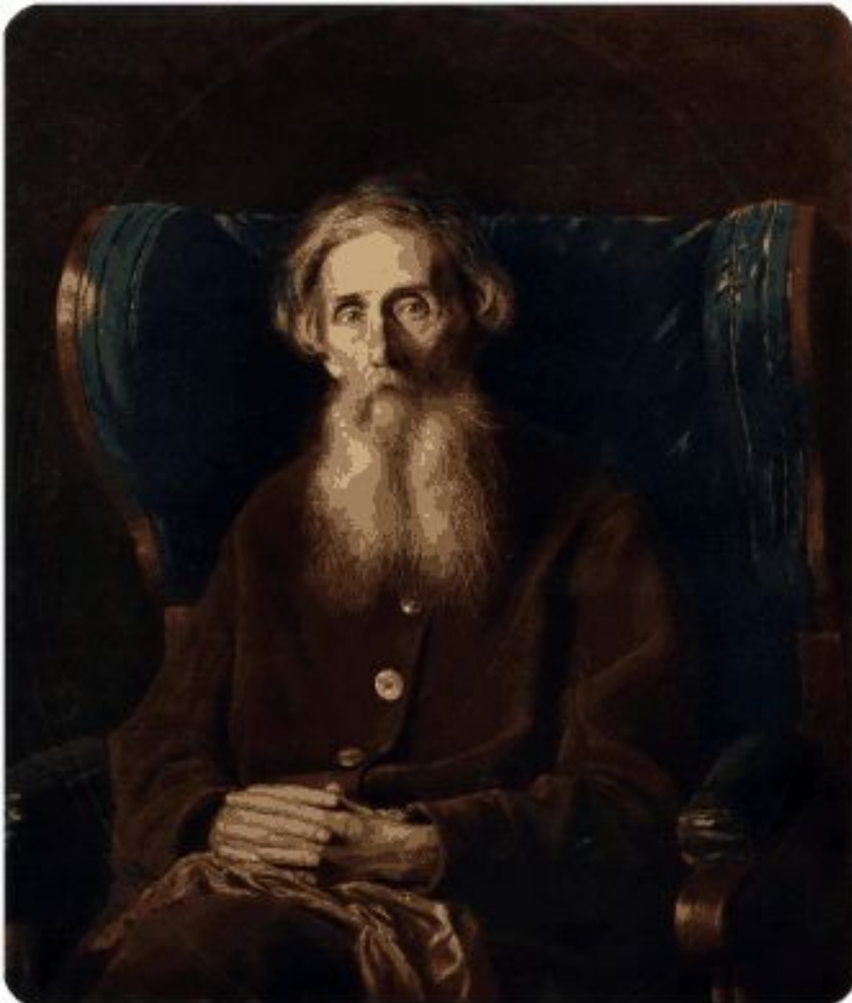
Даль Владимир Иванович 1801-1872