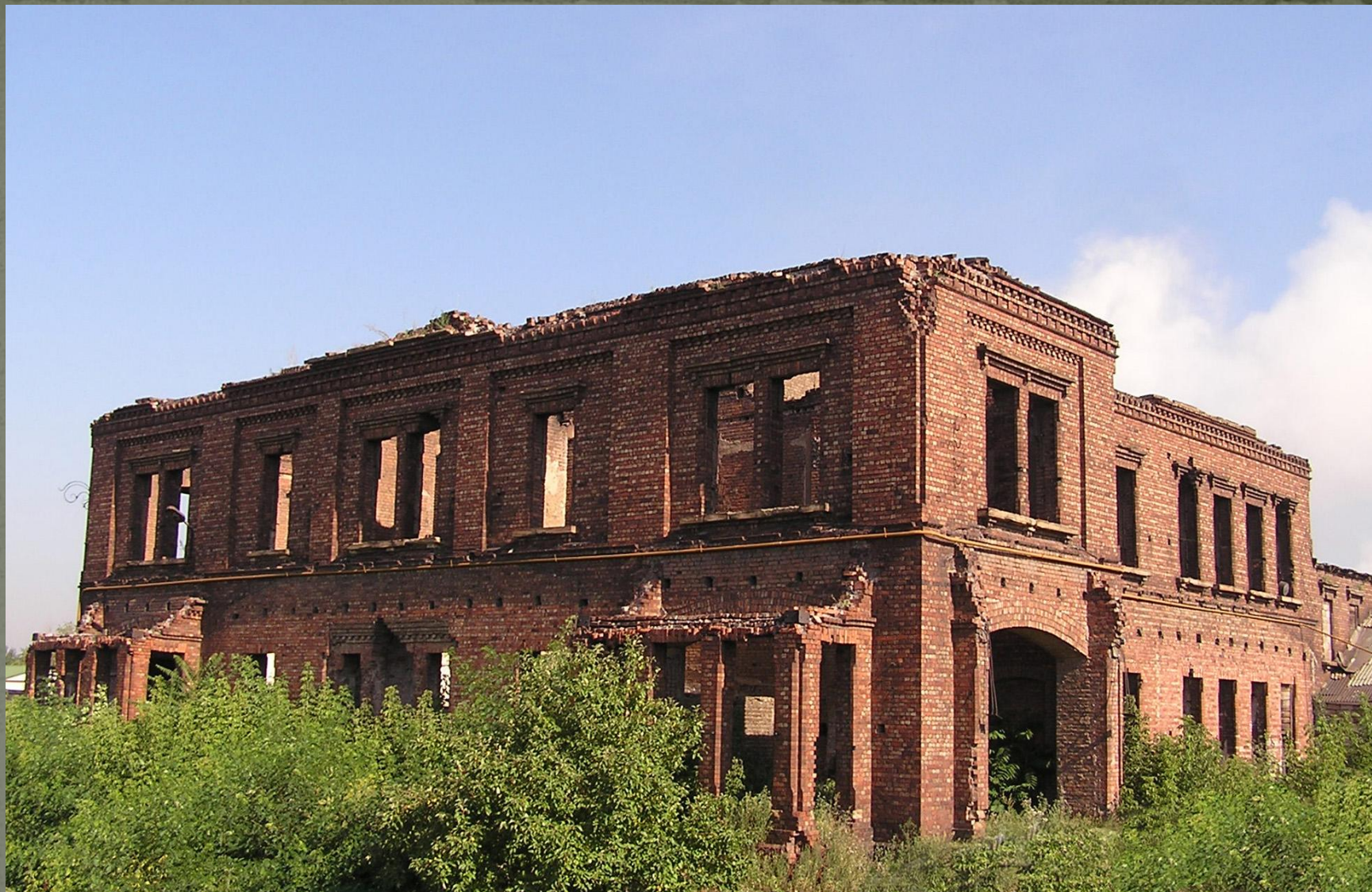
Вид дома в наше время.