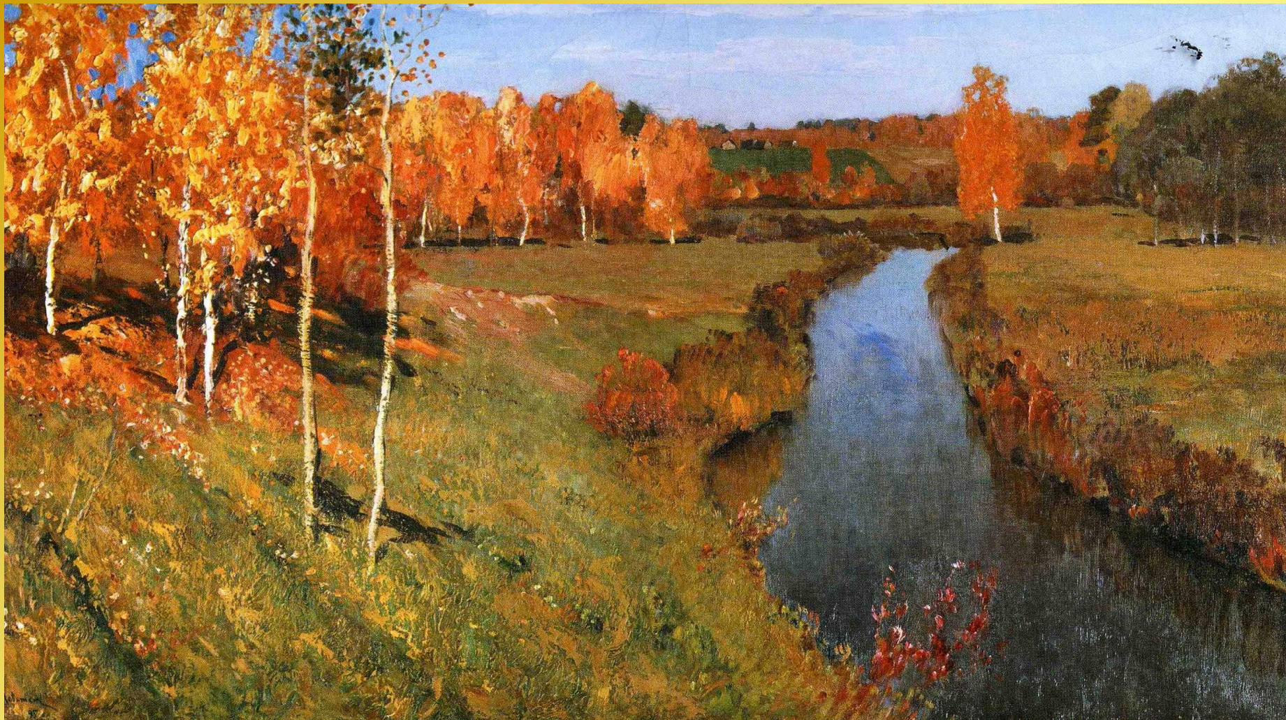
И.И. Левитан « Золотая осень »