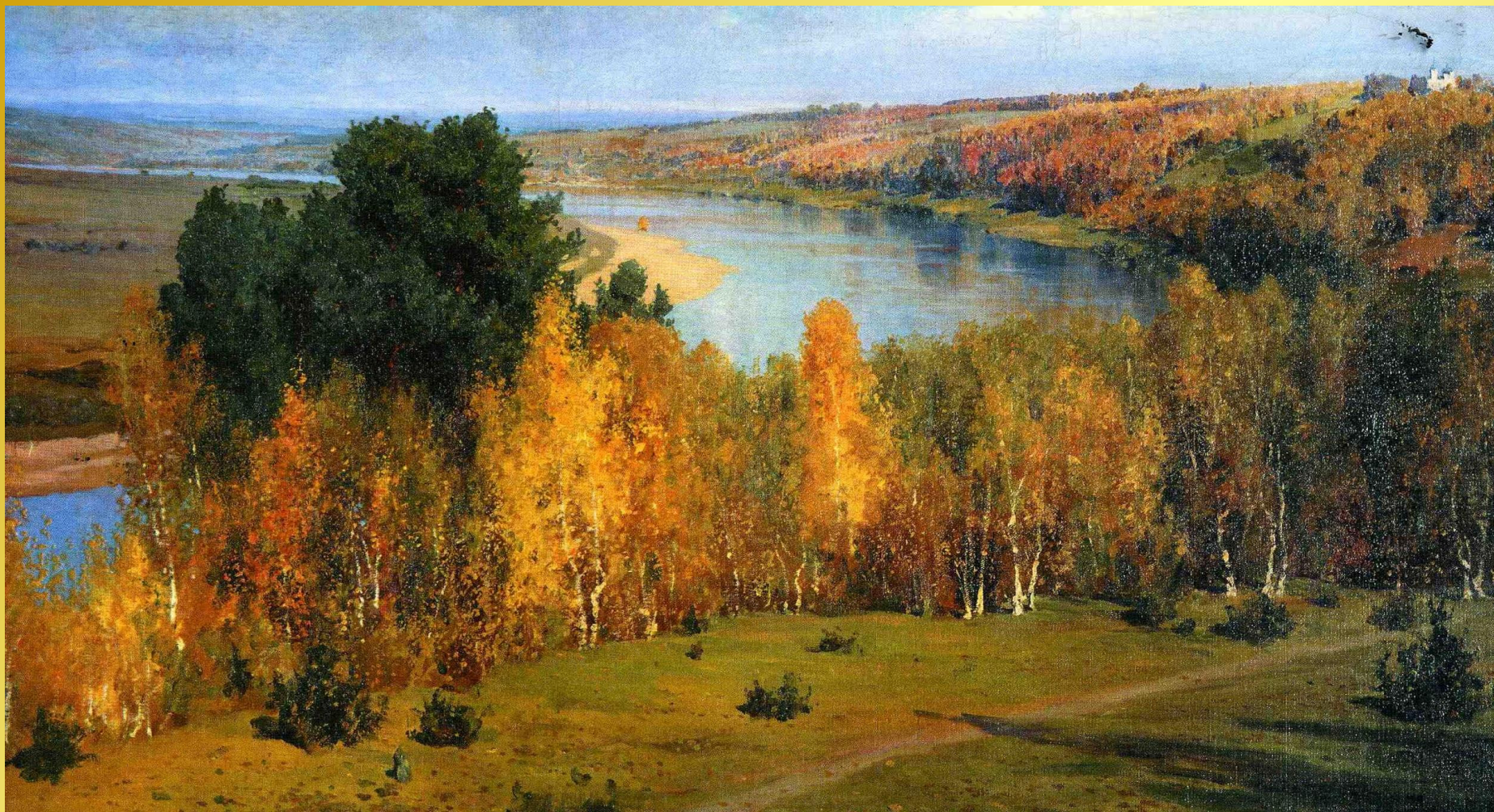
В.Д. Поленов «Золотая осень»