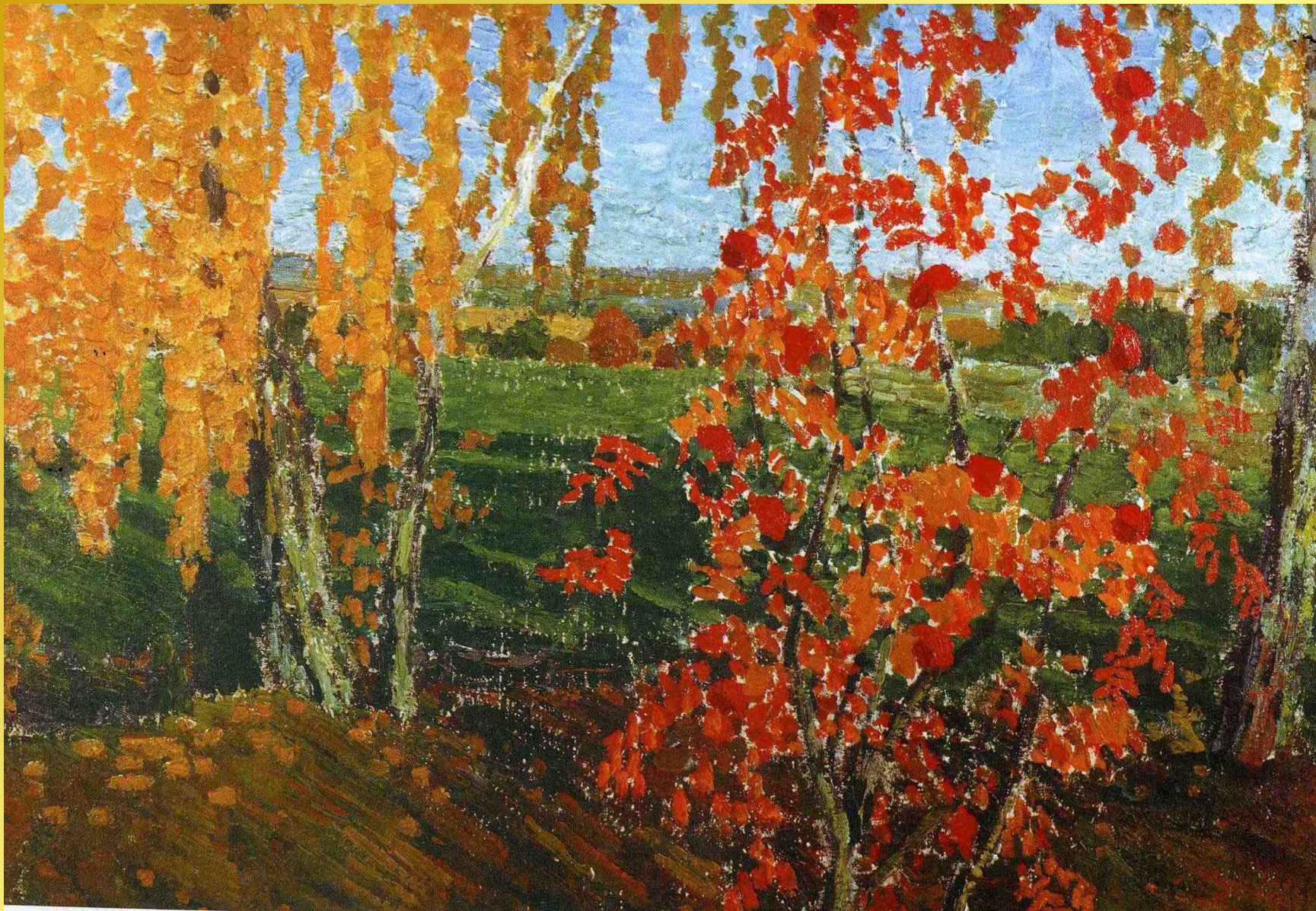
И.Э. Грабарь «Рябинка»