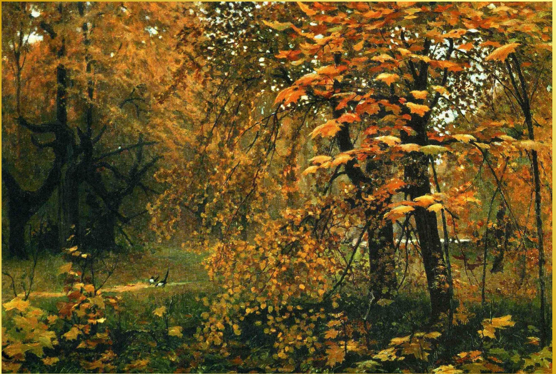
И.С. Остроухов «Золотая осень»