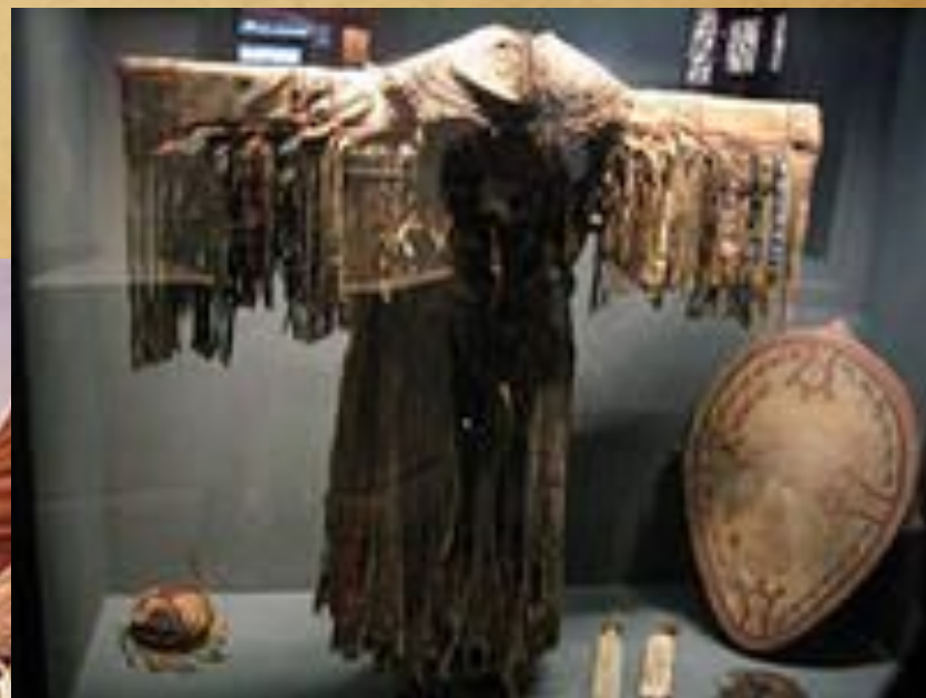
Костюм сибирского шамана