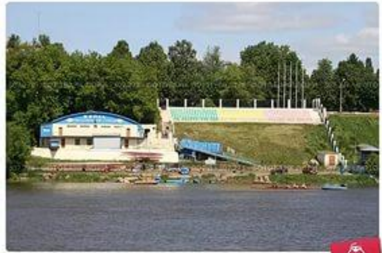
Школа олимпийского резерва по академической гребле, Коломна