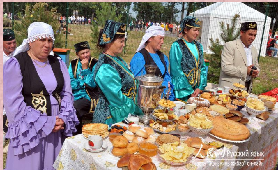
Русский язык Газета "Жэньминь жибао" он-лайн