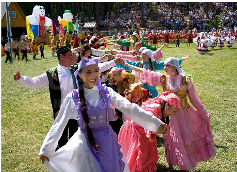
# mhzd000381 Sabantuy, Tatar national festival