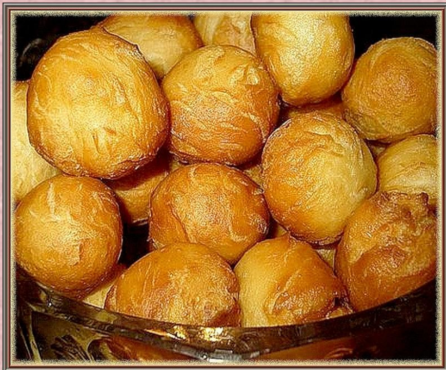
Казахское национальное блюдо до -