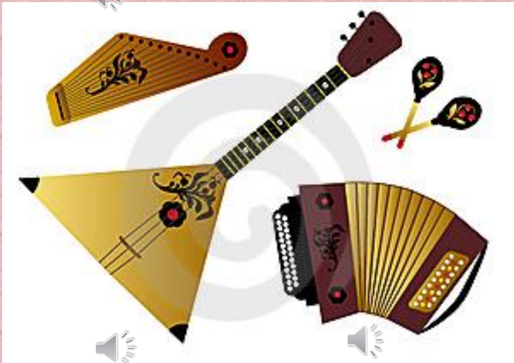
Русские народные музыкальные инструменты: балалайка, домра, гусли, гармошка, колокола и другие.