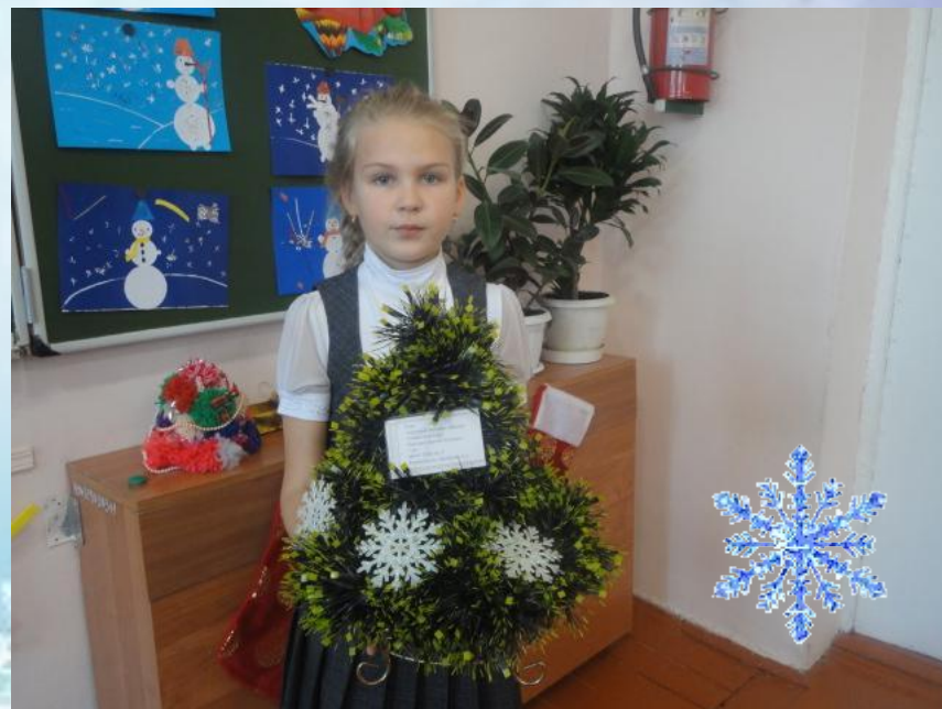
Черномор Ксения «Чудо - Ёлка»