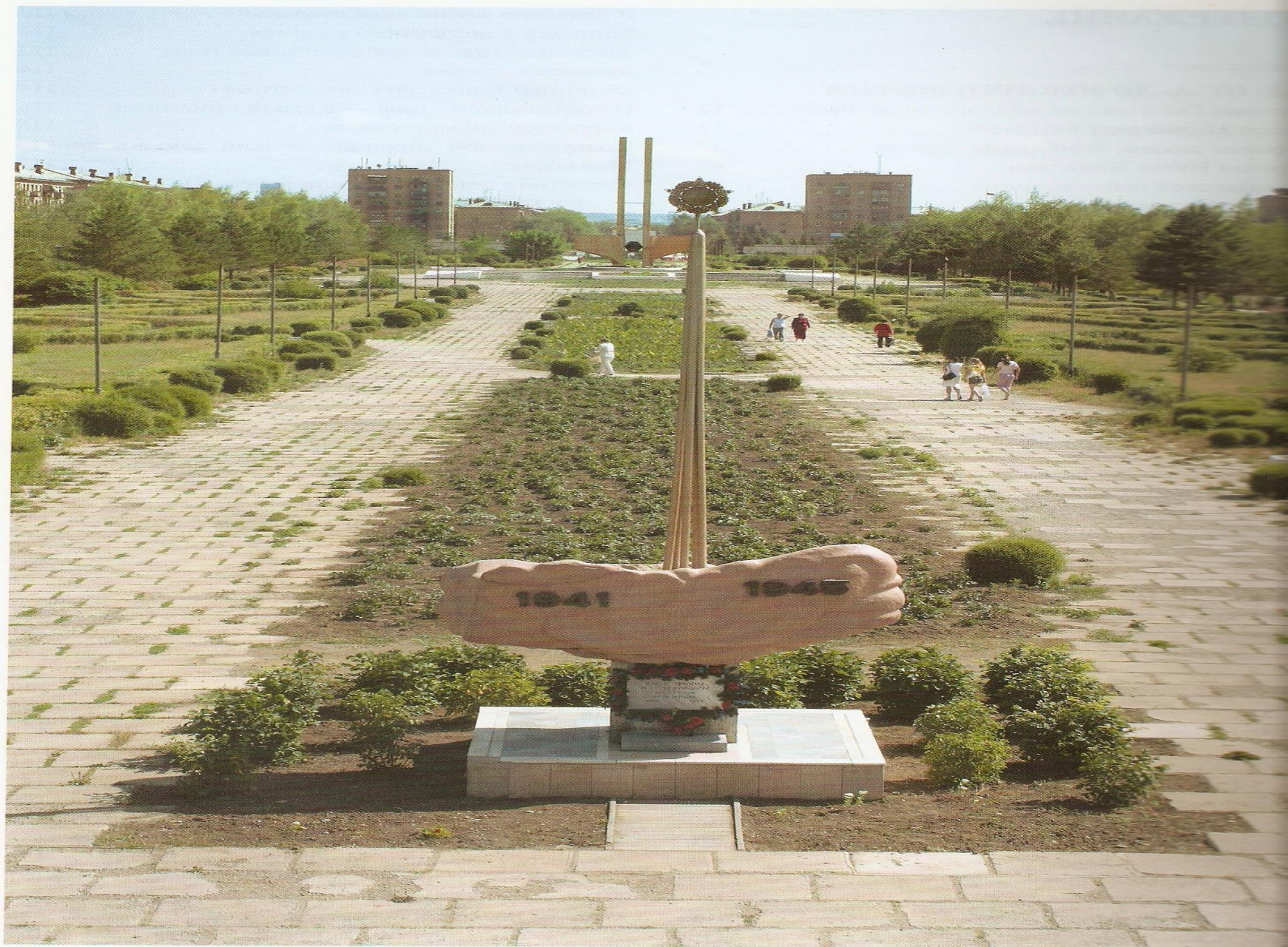
Обелиск «Выстоявшим и победившим, мертвым и живым. 1941—1945».