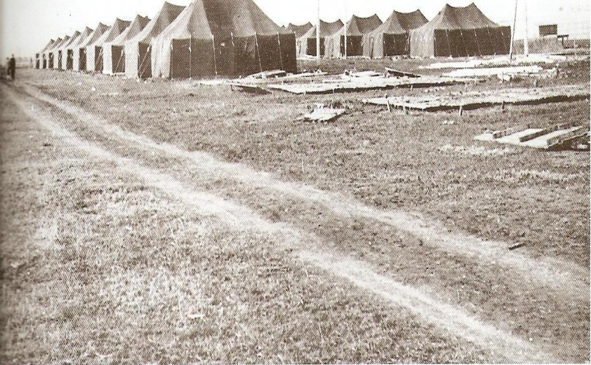
1959 год. Палаточный Гай.