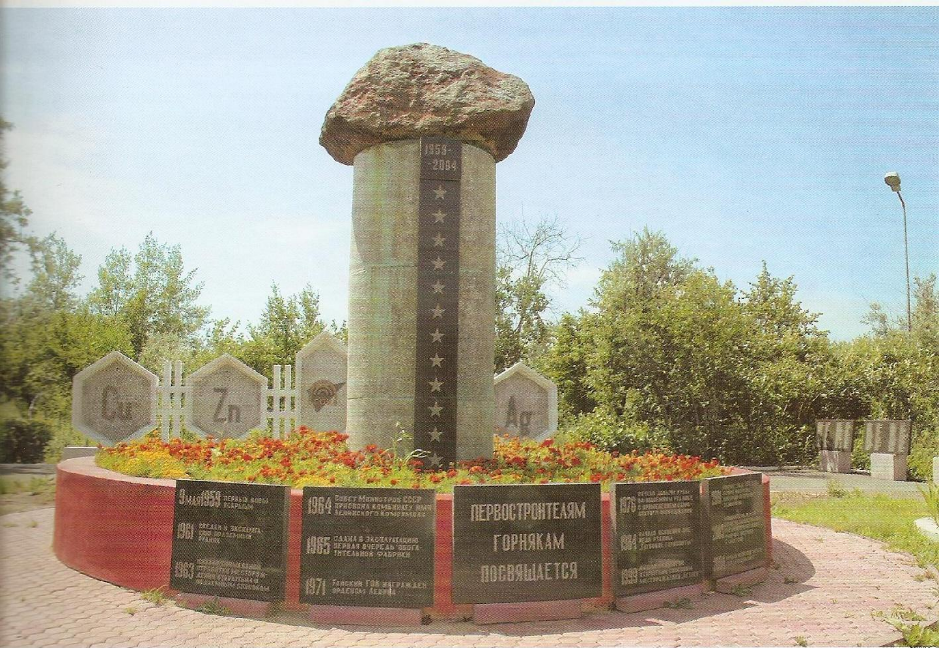
Монумент в сквере ОАО «Гайский ГОК».