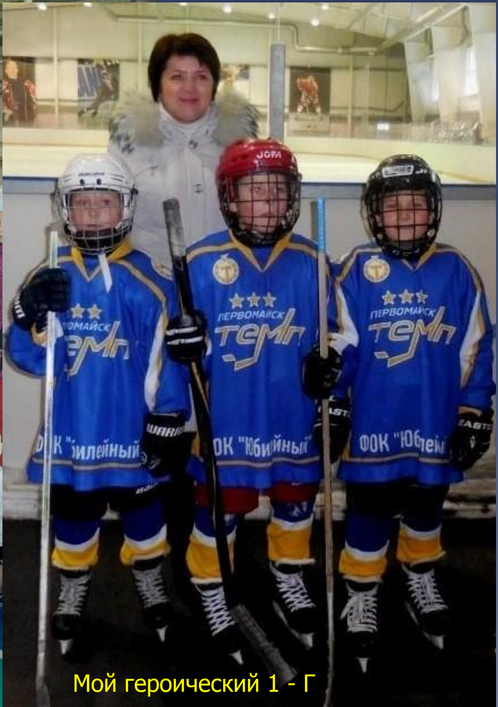
Мой героический 1 - Г