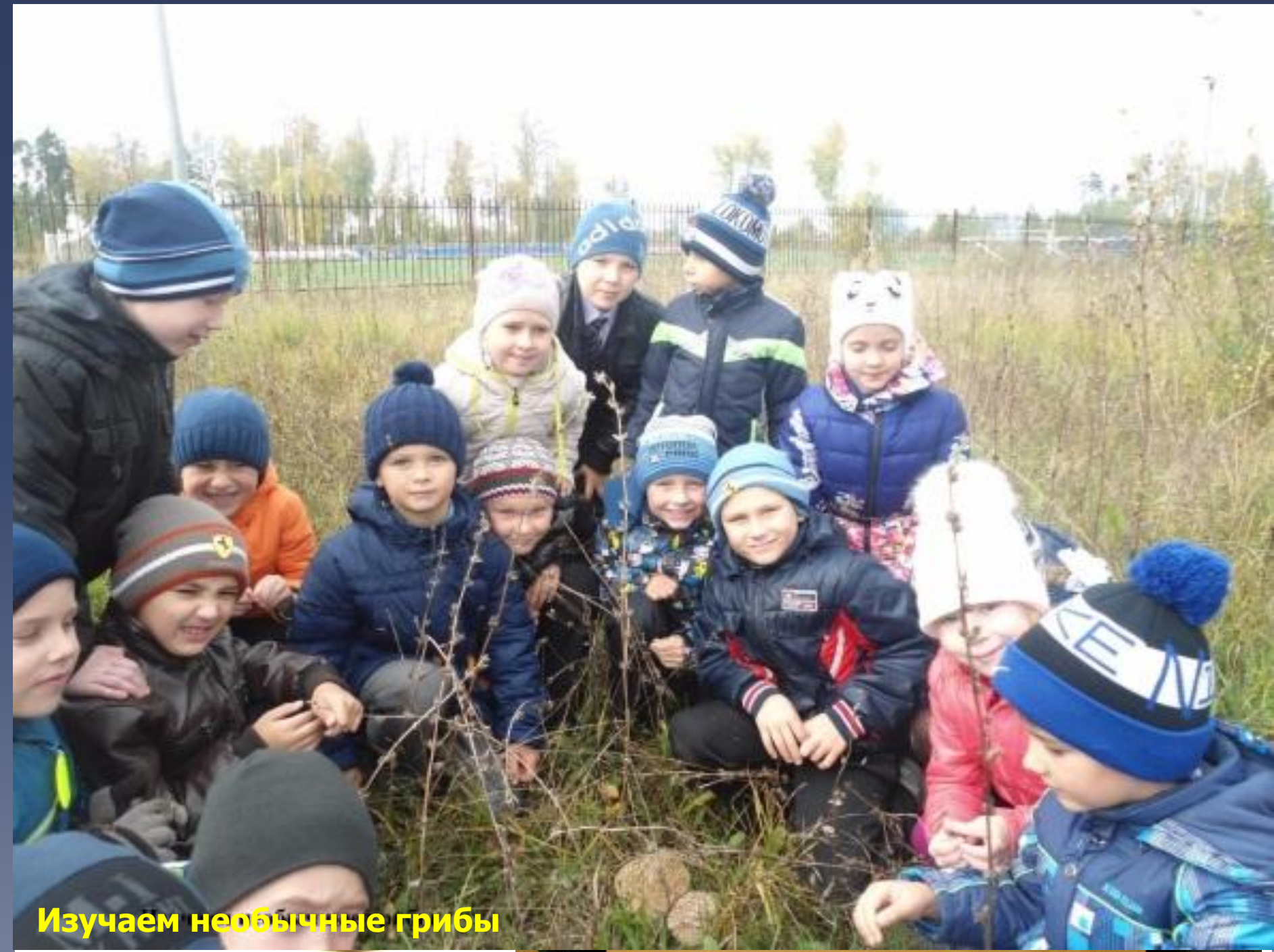
Изучаем необычные грибы