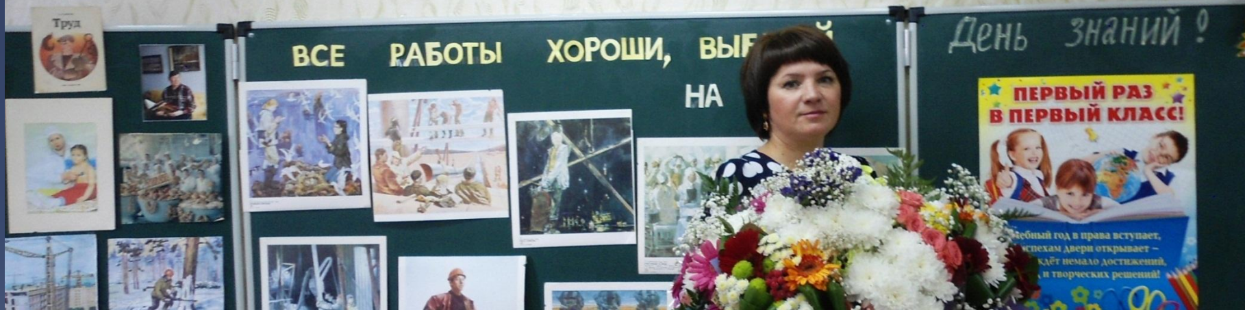
Проект «И славен Первомайск людьми»