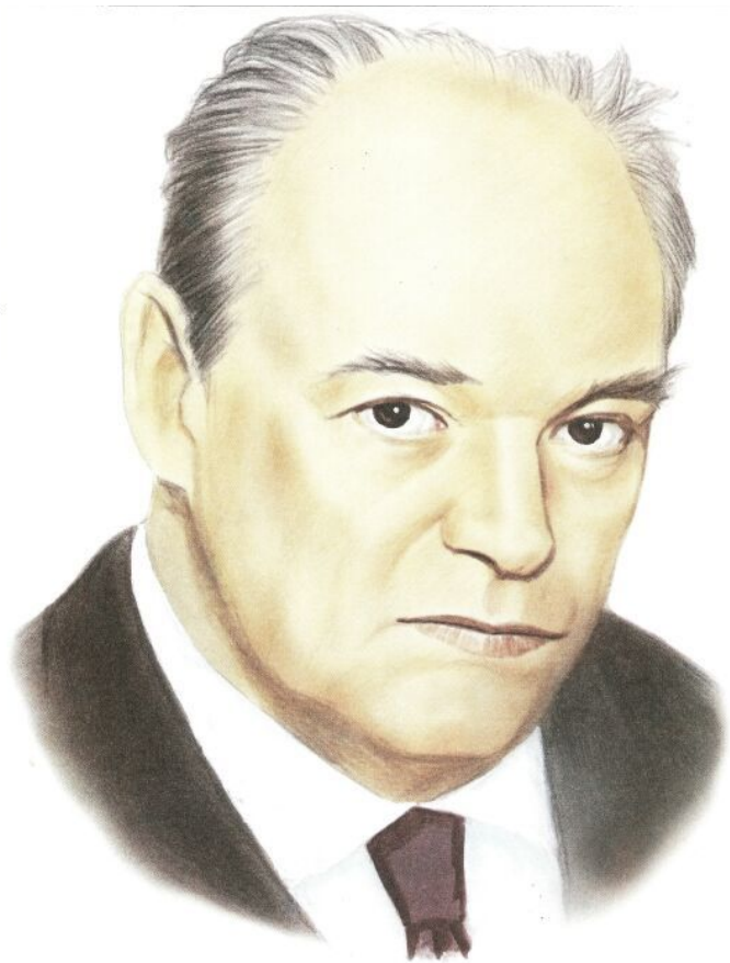
Чарушин Евгений Иванович (1901-1965)