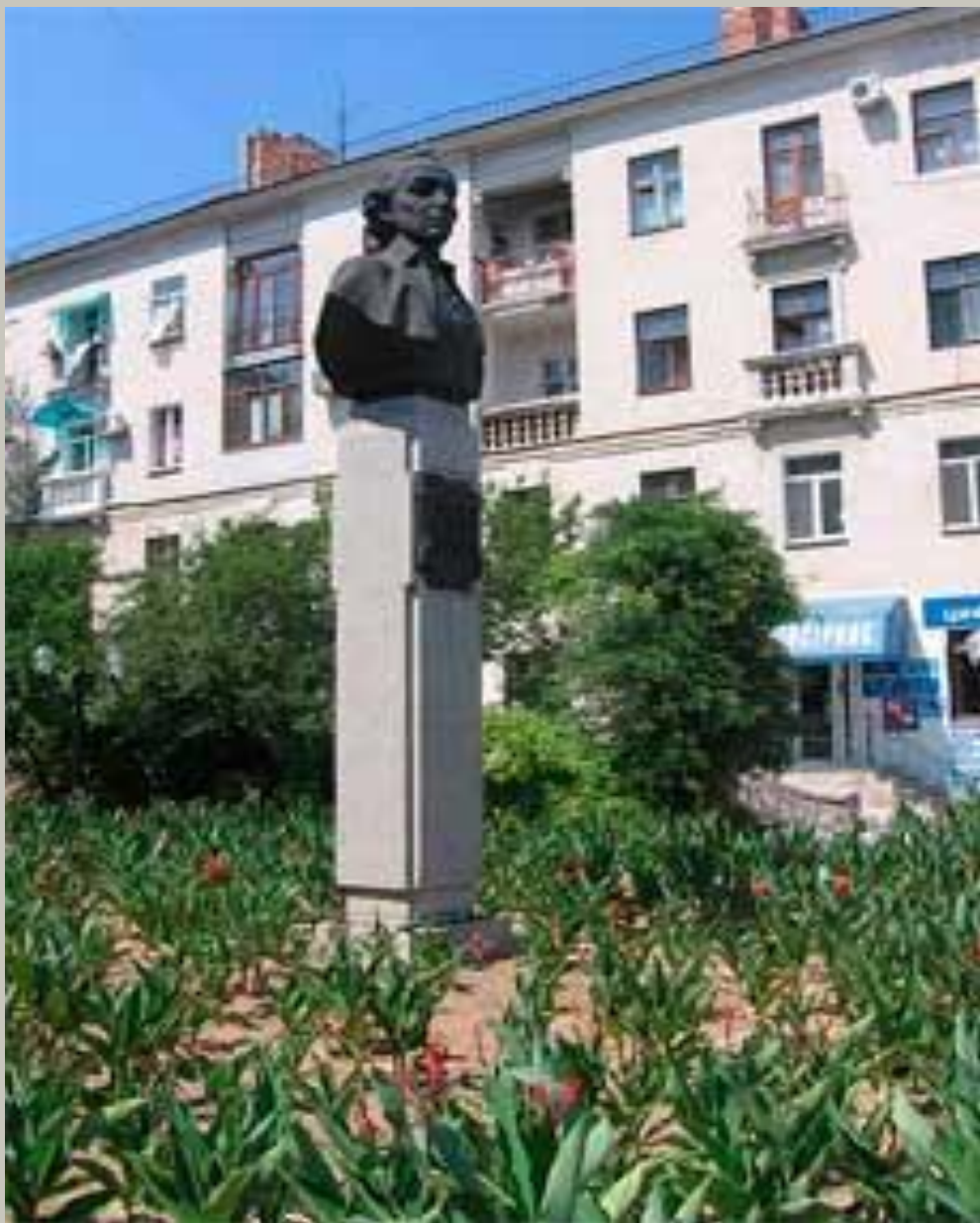
Памятник А. В. Суворову в Севастополе