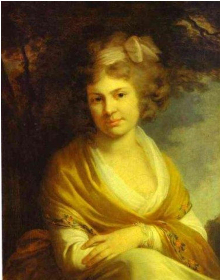
Дочь Суворова Наталья в 20 лет.