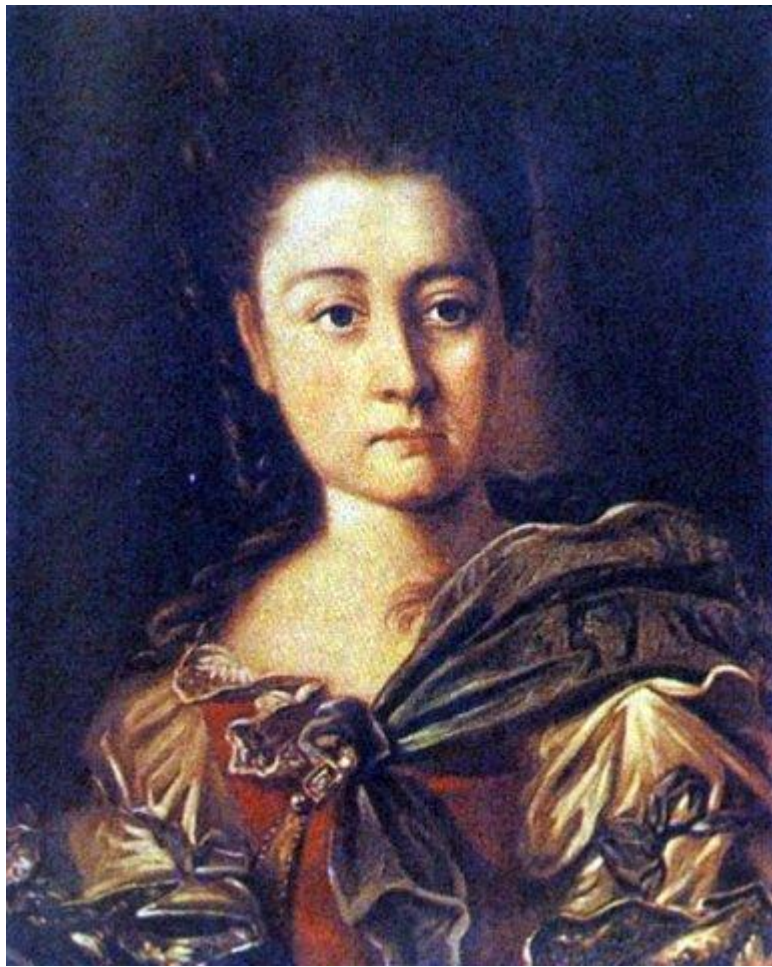
Жена полководца Варвара Ивановна Суворова. 1899 г.