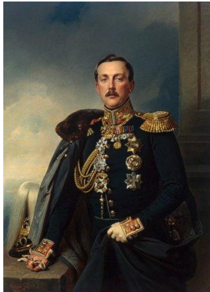
Внук Суворова Суворов А. А.