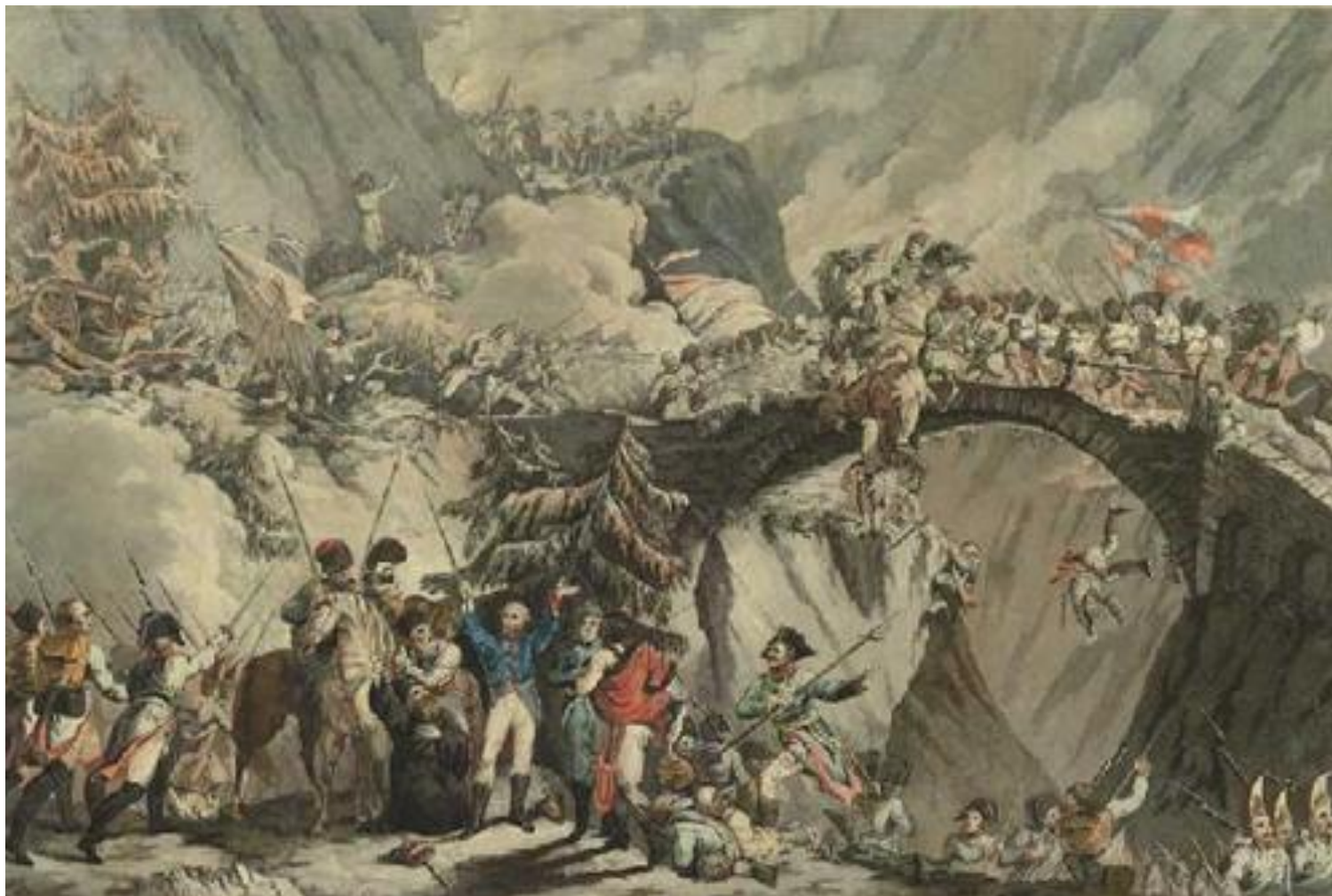
Чертов мост 1799 г