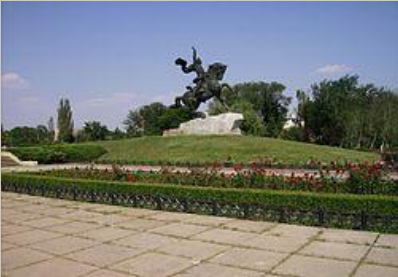
Памятник А. В. Суворову в Тирасполе