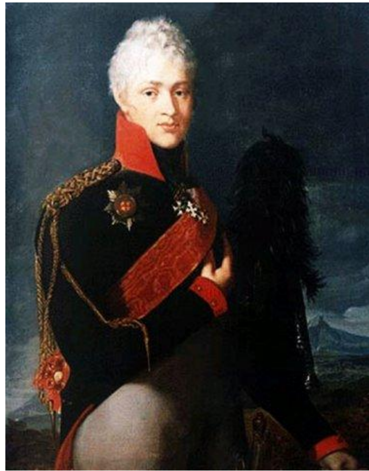
Аркадий Александрович Суворов (1784-1811) - сын генералиссимуса, генерал-лейтенант