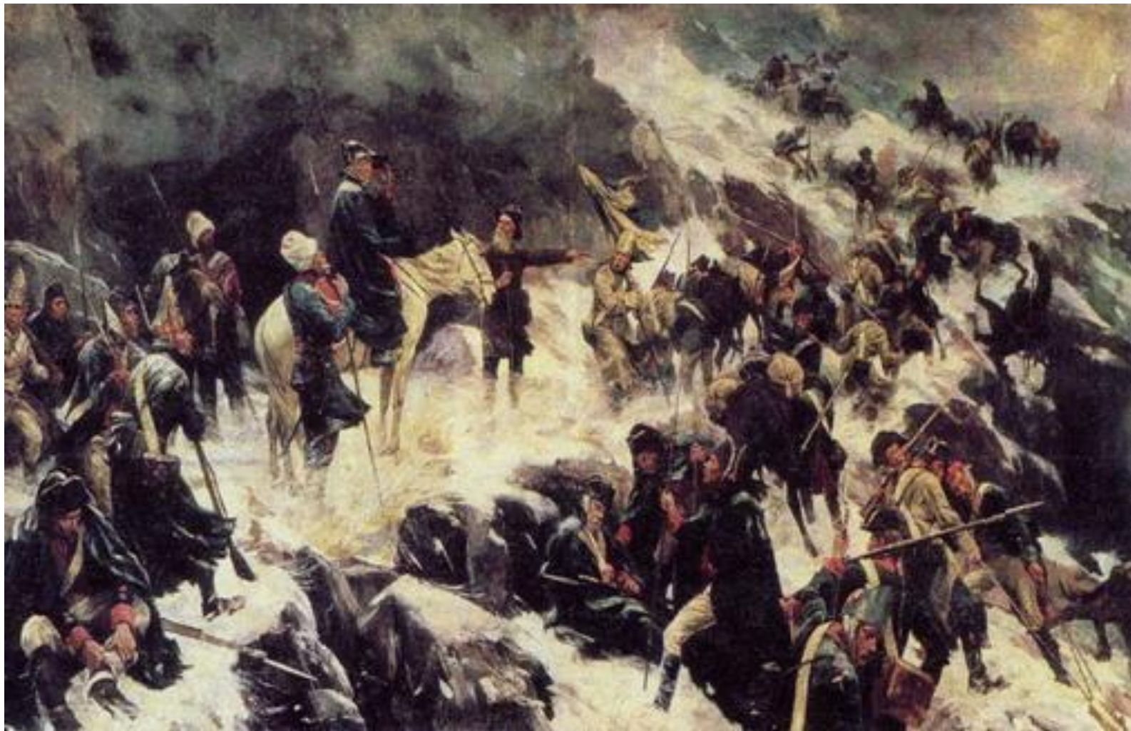
Переход через Альпы