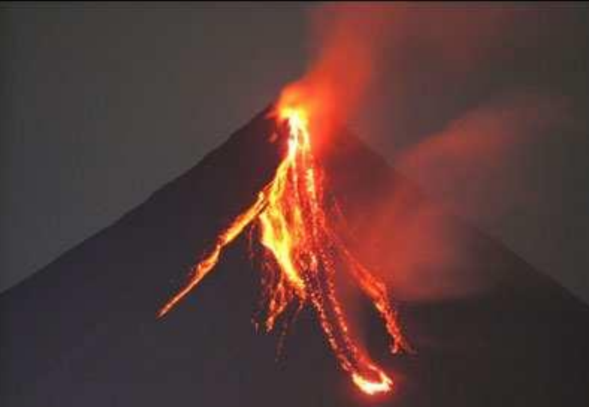
Вулканы кажутся красивыми, но они очень опасны. Ведь огненная каша-лава, выливаясь из горы, может разрушить города, где живут люди, устроить пожары.