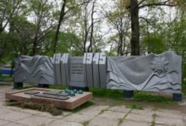
Памятник установлен в честь 40-летия Победы.