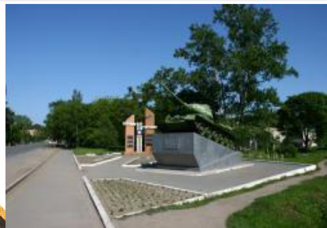
Памятник установлен в память об окончании Второй мировой войны к 50-летию Великой Победы советского народа в ВОВ.