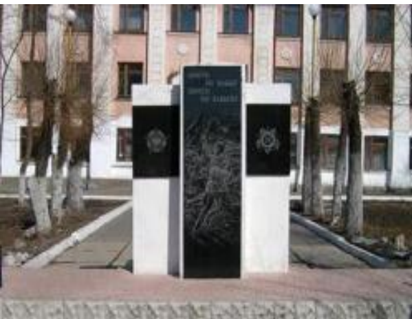
Памятник – обелиск, погибшим в годы Великой Отечественной войны «Вечная память героям»