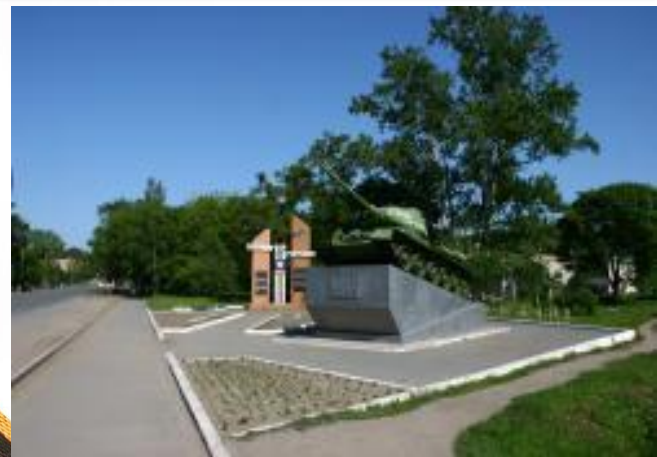
Памятник установлен в память об окончании Второй мировой войны к 50-летию Великой Победы советского народа в ВОВ.