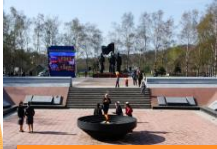
Памятник установлен жителям г. Артёма, погибшим годы ВОВ.