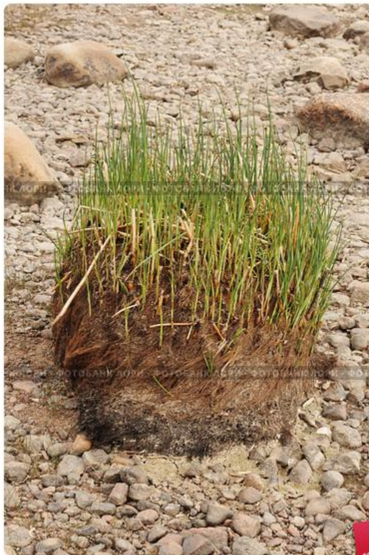
Дерн с ростками молодой травы