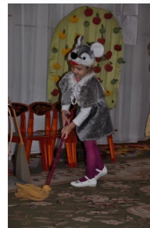
«Домик - балалайка»