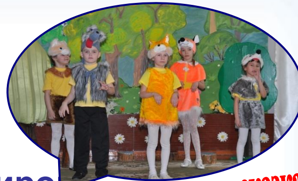
"Животные в сказках"

1. Регламентиро- анная деятельность по темам