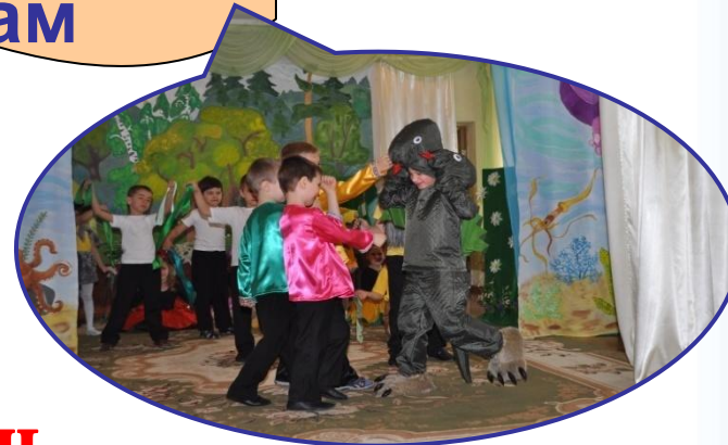
"Что за прелесть эти сказки"