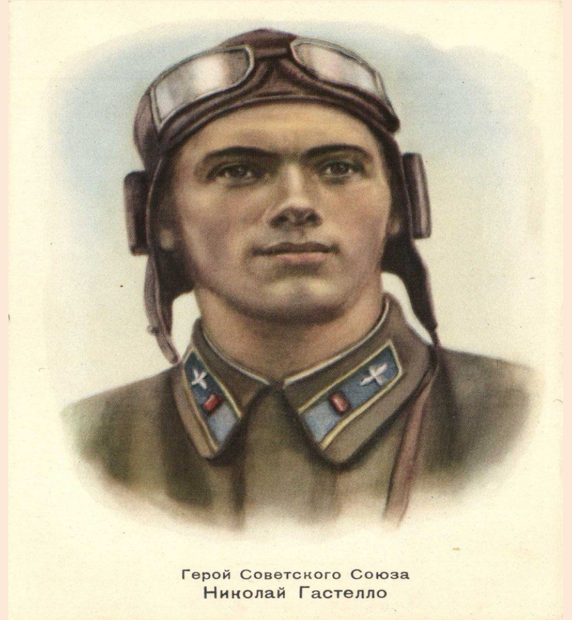
Герой Советского Союза Николай Гастелло