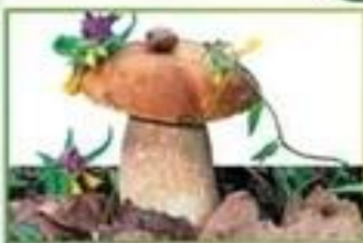
белый гриб (еловый)