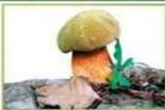
белый гриб (дубовый)