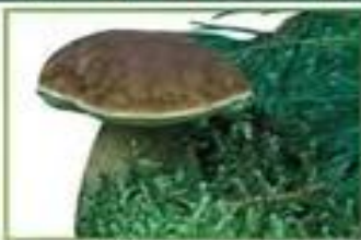
белый гриб (сосновый)