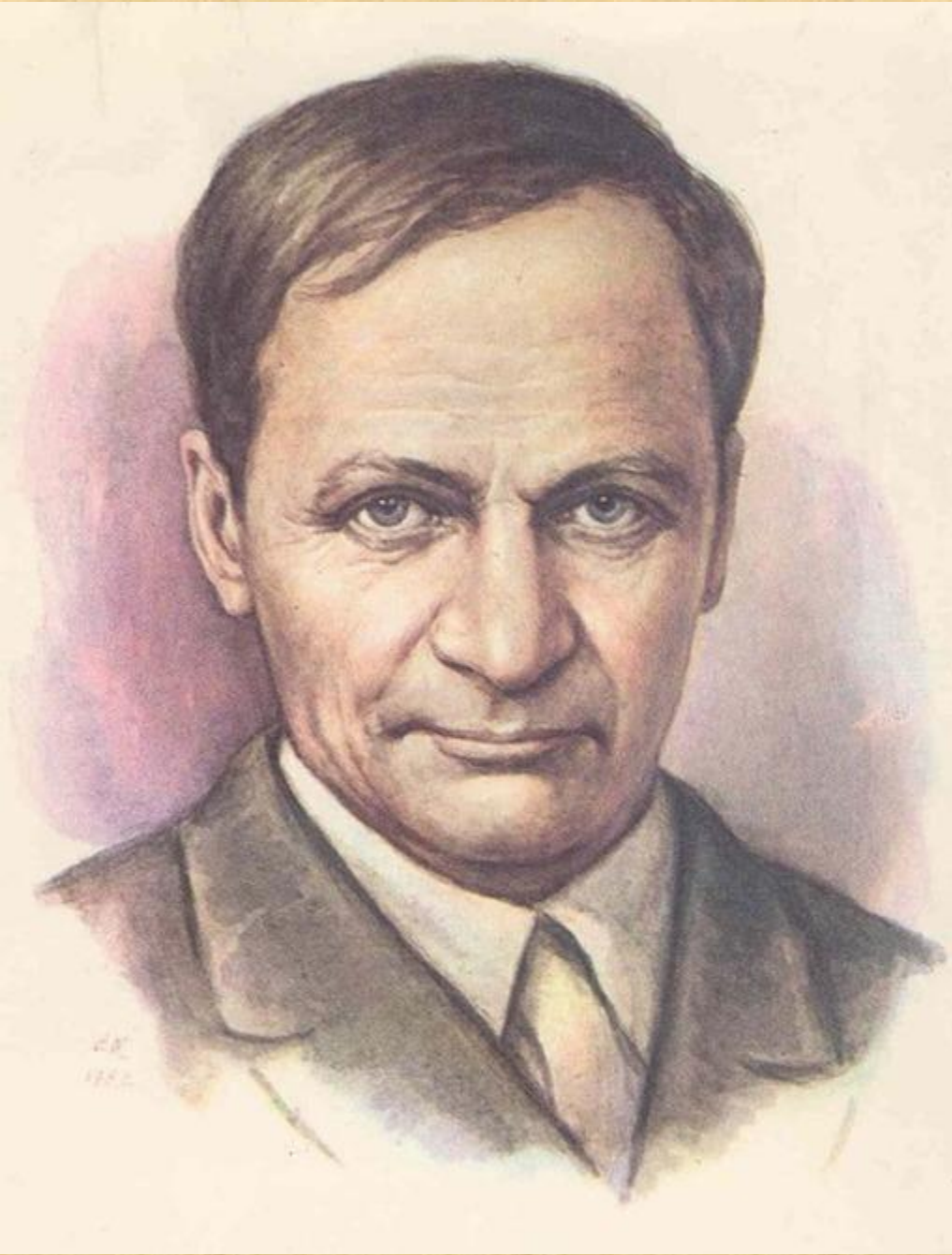
Андрей Платонович Платонов