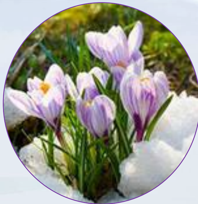
Подснежник – Galanthus- (сем. Амариллисовых)