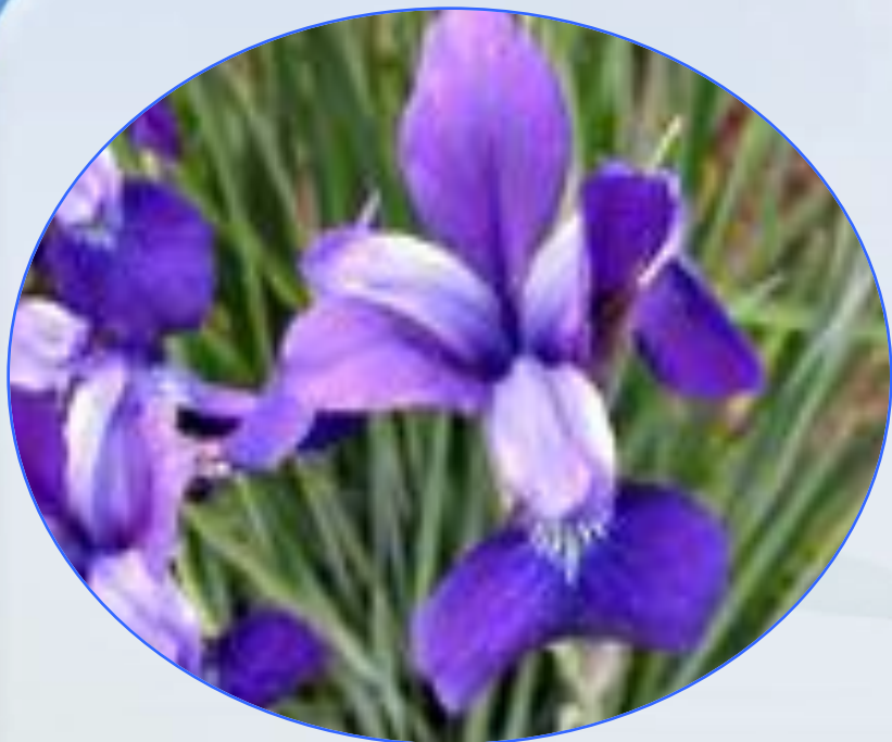
Ирис гладкий – (семейство касатиковые)